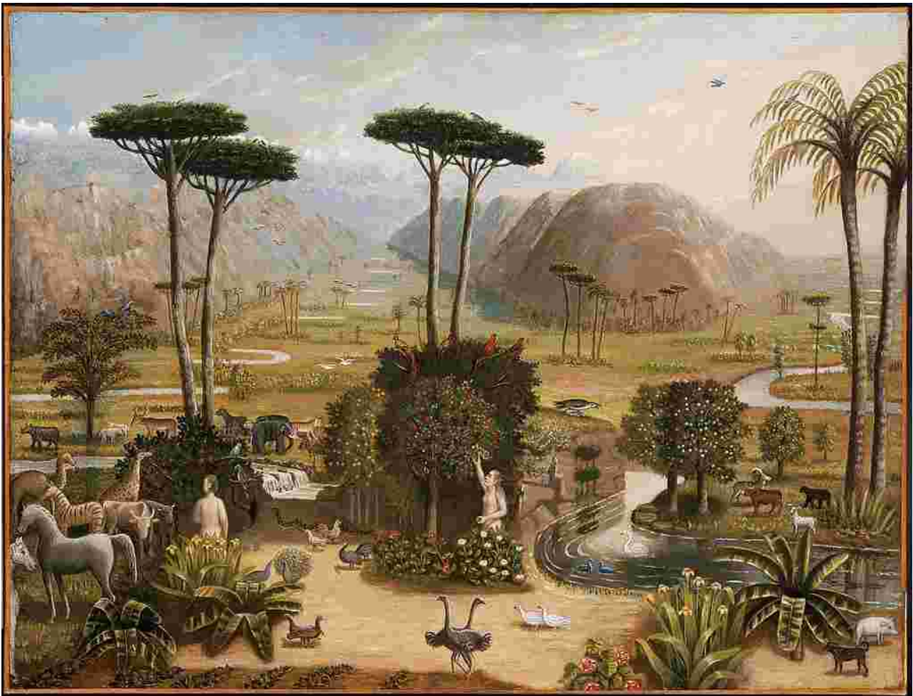
Figure 1. Le jardin d'Eden (Erastus Salisbury Field, 1860) a longtemps été l'archétype de la nature parfaite créée par Dieu, où tout est équilibre et harmonie. Cette métaphore continue à imprégner les discours écologistes qui parlent de retrouver une mythique nature originelle.