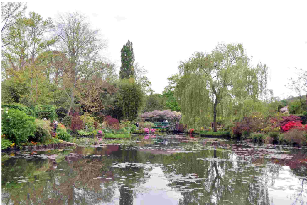
Figure 3. Le jardin de Claude Monet est composé d'espèces qui n'auraient pas eu la possibilité de cohabiter si l'homme n'était pas intervenu. On peut parler à ce sujet d'écologie de synthèse. Ce système artificiel, qui fait l'objet de l'admiration du public pour ses qualités esthétiques, est un exemple d'appréciation subjective de l'état d'un système écologique.

nature c'est protéger notre santé. Cette affirmation, qui prête à débat, laisse penser qu'il n'y aurait pas a priori de nature hostile ; c'est parce qu'elle a été modifiée par les hommes qui ont altéré les équilibres de la nature que cette dernière nous deviendrait hostile. Ainsi la pandémie de Covid-19 serait la faute des humains qui ne respectent pas la nature. Divers articles de presse (Courrier international, 2020 ; La Vie, 2020) n'ont pas manqué de renchérir, en suggérant que le Covid-19 pourrait être une « vengeance de la nature », ce qui correspond à de la pensée magique. Accuser l'homme d'une pandémie qui montre « la violence de la nature vis-à-vis de l'homme » est « un effarant retournement