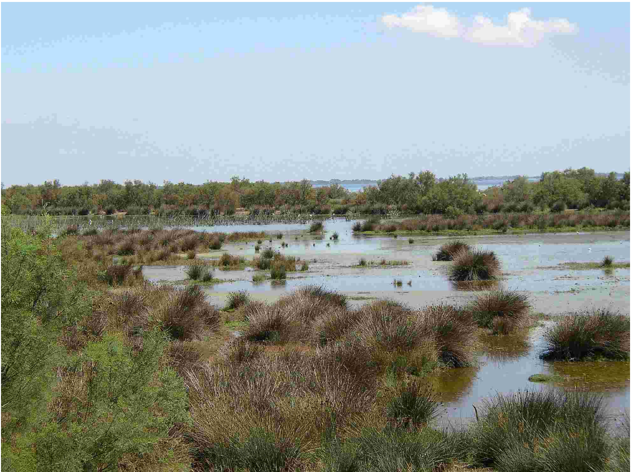
Figure 2. La Camargue est un système artificiel où l'on gère les apports en eau pour la riziculture. Elle est pourtant labellisée « parc naturel » et fort appréciée pour sa biodiversité. Ce n'est pas pour autant un écosystème « sain » pour les humains, car il est infesté de moustiques.

Dans ce contexte, un changement de la composition en espèces (perte ou gain) ne signifie donc pas dysfonctionnement, un jugement de valeur qui fait écho à une vision normative (Lévêque, 2016) de la nature. Il y a simplement des changements plus ou moins rapides ou progressifs de la composition et du fonctionnement. Se pose ici toute la problématique des introductions d'espèces dans un écosystème, que ce soit un événement spontané (une espèce étend son aire de distribution) ou une introduction volontaire.