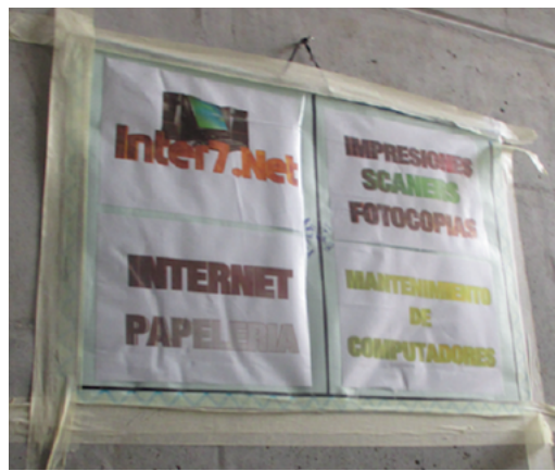
Figura 5. Aviso en los espacios comunes de Metro Usme 136

Dentro de los conjuntos estudiados, aparte de la venta ocasional de algunas verduras por parte de los ancianos, no se identifican apropiaciones de los espacios comunes para un uso comercial. Los pocos puestos informales de este sector están ubicados en el espacio público, en las aceras de la calle principal que conecta los diferentes conjuntos. Si la apropiación de este espacio puede percibirse como