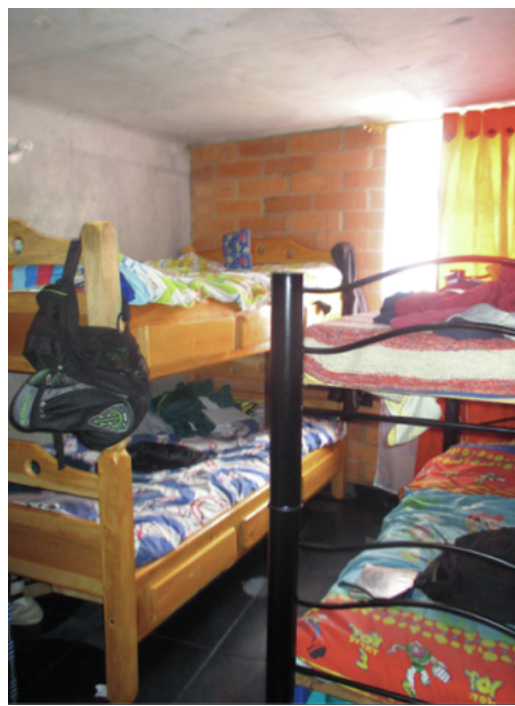
Figura 3. Situación de hacinamiento, Metro Usme 136

Un ejemplo de estrategias de elusión de las normas y prohibiciones propias del régimen de propiedad horizontal es el desarrollo de actividades productivas dentro de la vivienda, una práctica característica de los sectores populares. Se encuentran, entre otros, micro peluquerías, talleres de costura e incluso cibercafés dentro de