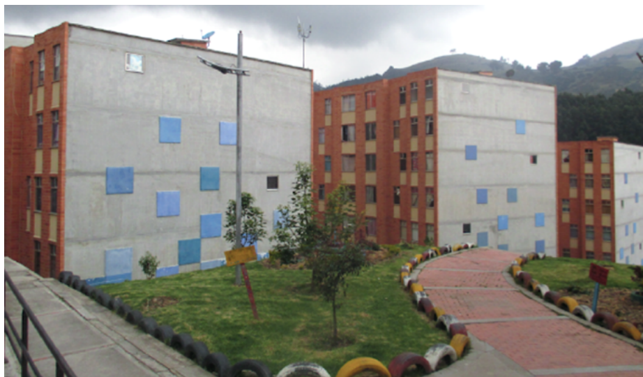
Figura 6. Embellecimiento del conjunto Metro Usme 136 por los residentes (bordes y árboles)