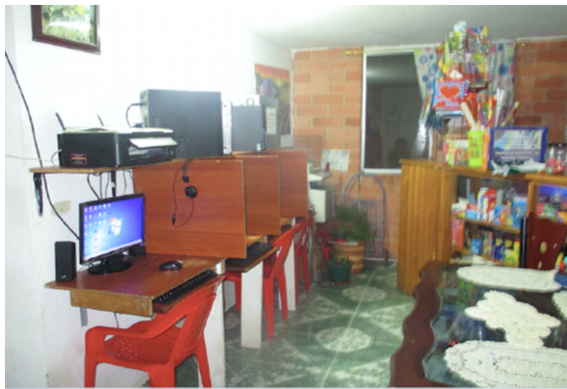
Figura 4. Cibercafé en un apartamento de Metro Usme 136

Finalmente, a menos de cinco años de su entrega, estos apartamentos aparecen como espacios “híbridos” y “multifuncionales” (Santamaría, 2008), resultado de una doble dinámica de apropiación, a través de la transformación material, por un lado, y del desvío de los usos previstos para estos espacios, por otro. Estos procesos ponen de relieve una reproducción de los modos de vida característicos de los sectores populares. Esta “informalización” (Ferme, 2012) de los espacios diseñados y producidos por los promotores va más allá de los límites de la esfera doméstica, para extenderse hacia los