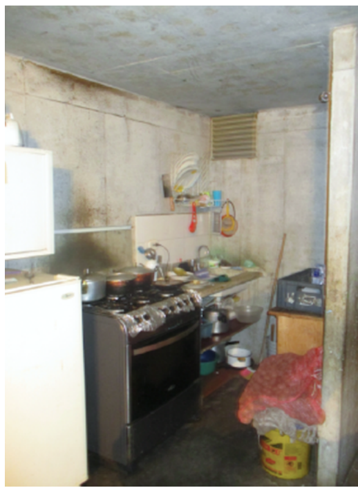
Figura 2. Cocina en obra gris, Metro Usme 136

La imposibilidad de transformar los apartamentos en función de la evolución de los hogares, puede dar lugar a situaciones de hacinamiento crítico observadas en varias de las viviendas visitadas (figura 3). Los habitantes deben entonces adaptarse a la disposición arquitectónica de los espacios domésticos. Por ejemplo, Estaban, que vive en Metro Usme 136, despliega un colchón en la sala de estar para dormir allí por la noche, mientras las otras seis personas se comparten las dos habitaciones.