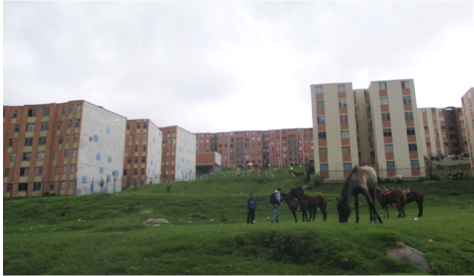
Figura 7. Jóvenes del pueblo con sus caballos