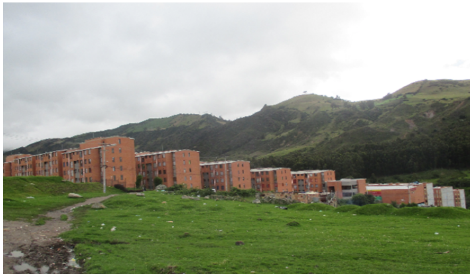
Figura 8. Proximidad de la Ciudadela con paisajes naturales