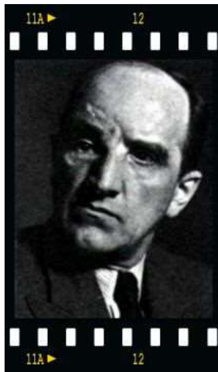
Ernst Moritz Mungenast

Ce roman paru à l'été 1939 eut à son époque un énorme succès, et fut réédité dix fois la même année. Il est assez facile d'en relever les faiblesses, notamment dans la glorification d'une Lorraine éternelle aux allures de pays de cocagne. On reste malgré tout impressionné par le portrait, sans équivalent dans la littérature, de la ville de Metz autour de 1900, dont les différents aspects s'incarnent dans des personnages qui sont autant de visions possibles de la « question d'Alsace-Lorraine » telle qu'elle se posait aux contemporains. Mungenast n'est pas un romancier de divertissement, il est chroniqueur au sens historico-politique, cherchant à éclairer par le biais