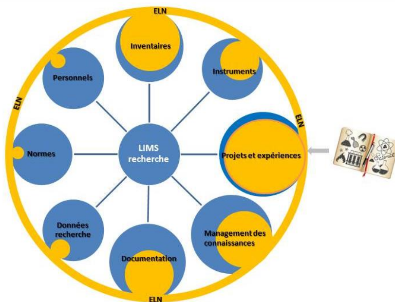
Figure 4 - : Place de l'ELN dans le LIMS

Le cahier de laboratoire électronique est une des composantes du LIMS. L'ELN ne s'intéresse qu'aux aspects scientifiques et plus précisément à tous les éléments touchant aux expériences. Le LIMS englobe également en plus les aspects de gestion des finances, des ressources humaines, des données de recherche, de maintenance du matériel, du stockage de produits chimiques.