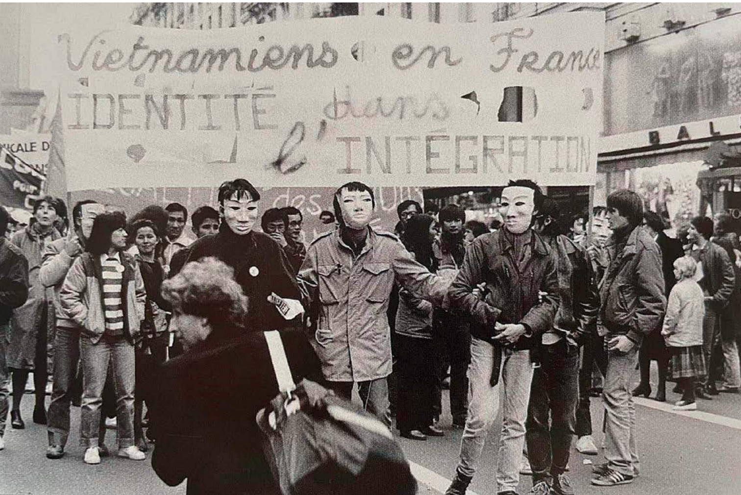
► Cortège des Vietnamiens de France, dont des membres de l'Union générale des Vietnamiens de France (UGVF), à l'arrivée de Convergence 84. Rue de Rennes (Paris), 1984.