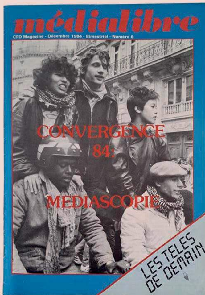
► La Une du magazine Médialibre , décembre 1984.

menées par la communauté chinoise au début des années 2010 sont suivies par deux autres mobilisations collectives : celles dénonçant le racisme et les violences subies, dont les violences policières (milieu des années 2010) suite aux décès de Zhang Chaolin en 2016 et de Liu Shaoyao en 2017 ; et celle qui accompagne la pandémie de Covid-19 (post 2020), et jalonne une nouvelle ère de lutte antiraciste 4 . La fin des années 2010 est également marquée par une affaire relative à des agressions commises contre des personnes