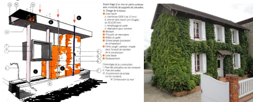
Figure 1 Mur en paille porteuse – La technique Nebraska (Floissac, 2012) Maison Feuillette à Montargis

La paille, isolant reconnu, peut aussi constituer l'élément porteur principal d'une construction. Cette idée, apparue avec l'invention de la botteuse aux Etats-Unis à la fin du XIX e siècle, consiste à empiler des bottes de paille de taille standardisée. L'ensemble est ensuite précontraint afin de former un mur rigide (Quirant 2018).