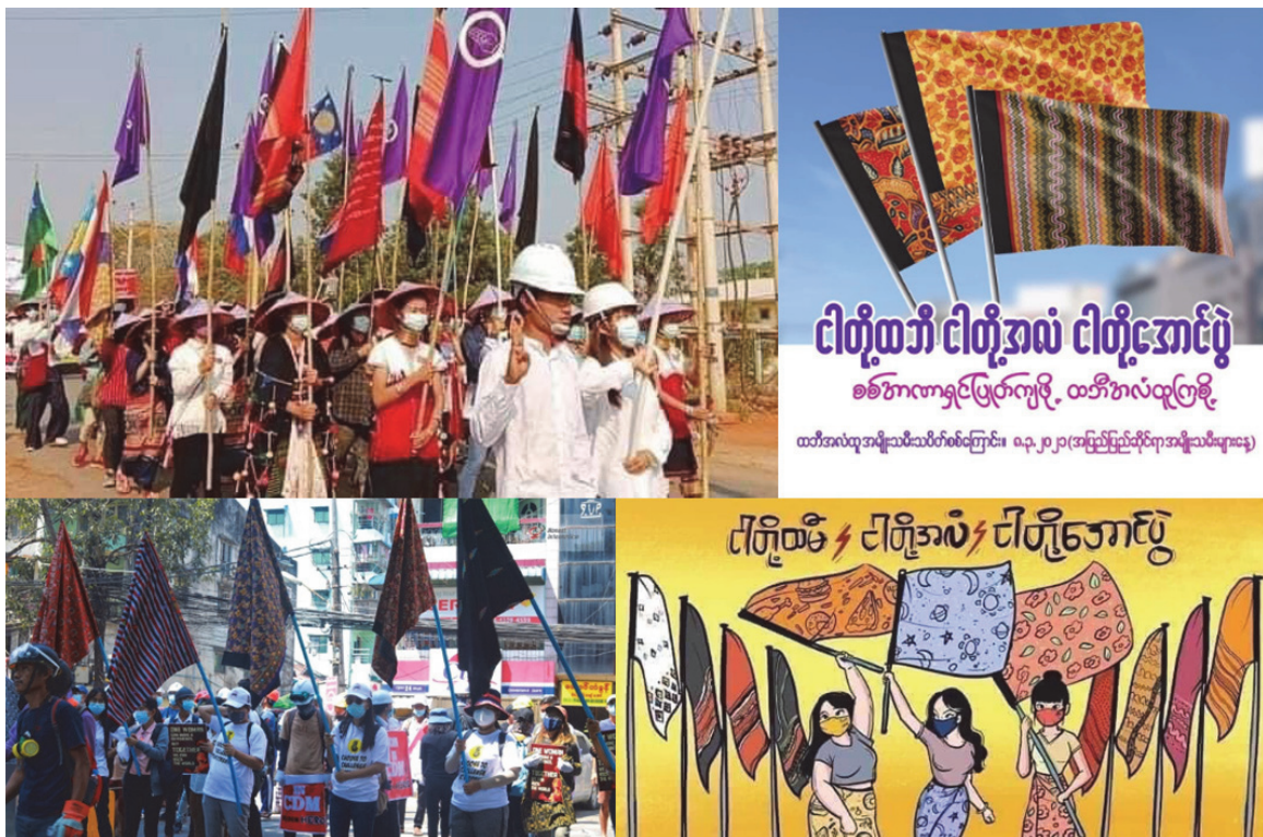
Figure 4 : Posts Facebook et visuels illustrant la « Révolution des htamein », entre mars et juillet 2021 Post en haut à droite : « Nos htamein , nos drapeaux, notre victoire », « Pour faire tomber la dictature, levons les drapeaux de htamein », 8 mars 2021 (Journée internationale des femmes).

liées. Pour l'une d'entre elles, avec qui j'ai pu discuter plus ouvertement de ces questions, la révolte des htamein était une véritable révolution sociale, dans la mesure où des femmes avaient osé brandir fièrement leur htamein , étaient parvenus non sans peine à convaincre certains hommes à s'afficher, dans les cortèges et sur les réseaux sociaux, htamein sur la tête. La campagne est ainsi devenue non seulement un outil de dénonciation politique des pratiques des militaires perçues comme superstitieuses mais aussi un symbole plus général de la lutte des femmes pour l'égalité des sexes et contre le patriarcat imposé par les hommes dont les militaires constituent la principale représentation. Cette activiste comme beaucoup de jeunes résistantes ont pris part au mouvement des htamein , non pas pour agir rituellement contre les militaires, mais pour encourager un discours de déconstruction des normes genrées de pouvoir. Si la société est incapable de penser le pouvoir constitutif de chaque homme sans le hpon , me confiera-t-elle, l'autorité ne pourra alors jamais être pensée en dehors de cet attribut considéré comme masculin, et les femmes demeureront exclues du pouvoir.