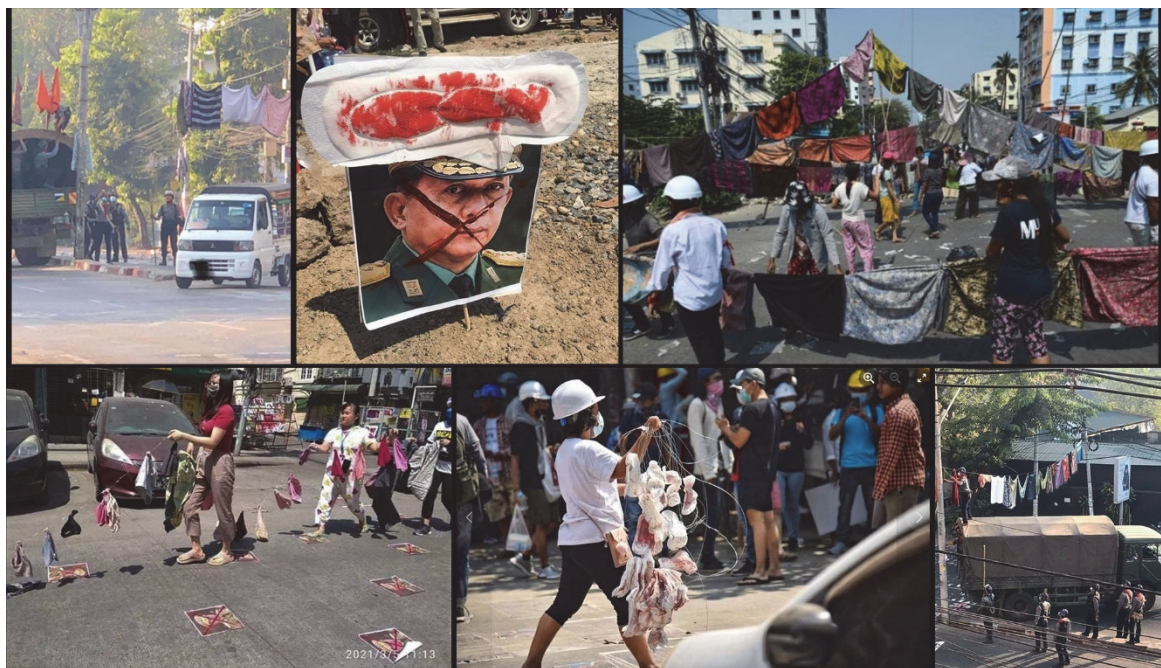
Figure 3 : Post Facebook illustrant la « Révolution des htamein » dans les rues de Rangoun, mars 2021

Dans les multiples posts partagés par la résistance, plusieurs expressions birmanes signifient « faire décliner » ou « dégrader » le pouvoir des militaires : en s'intéressant à ces expressions, on commence à comprendre comment le pouvoir est visé par ces modes d'action et pourquoi le htamein est ainsi mis en scène. L'expression la plus courante désignant l'efficacité du htamein est hpon hnein de (ဖုန်းနိမ့်တယ်, faire baisser le hpon ) ; tandis que les autres modes d'action visent à dégrader le nan ( nan hnein de , နာမ်နိမ့်တယ်) ou à faire baisser le kan ( kan hnein de , ကံနိမ့်တယ်). Ces trois expressions ont des similarités, même si elles se déclinent selon des concepts différenciés : le hpon est un capital personnel bouddhique qui est le résultat cumulatif