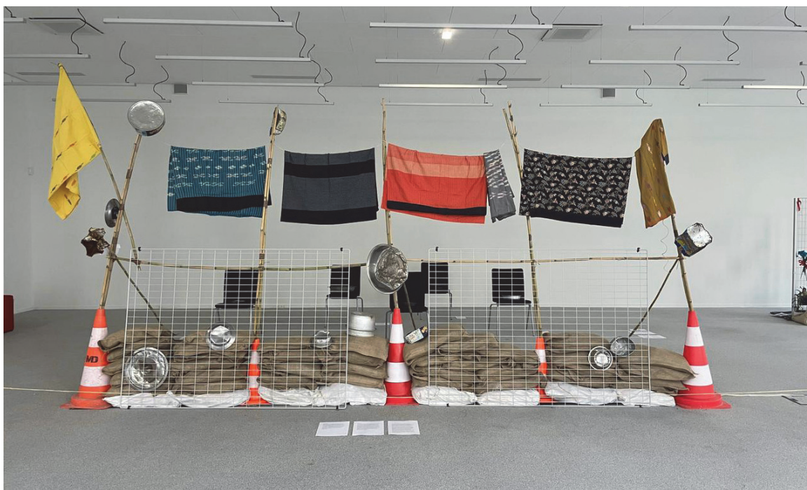
Figure 5 : Photographie d'une barricade réalisée dans le cadre de l'exposition « Yadeya & the Coup: Taking Action in Myanmar's Revolution », Conférence EuroSEAS 2022, Campus Condorcet, Aubervilliers