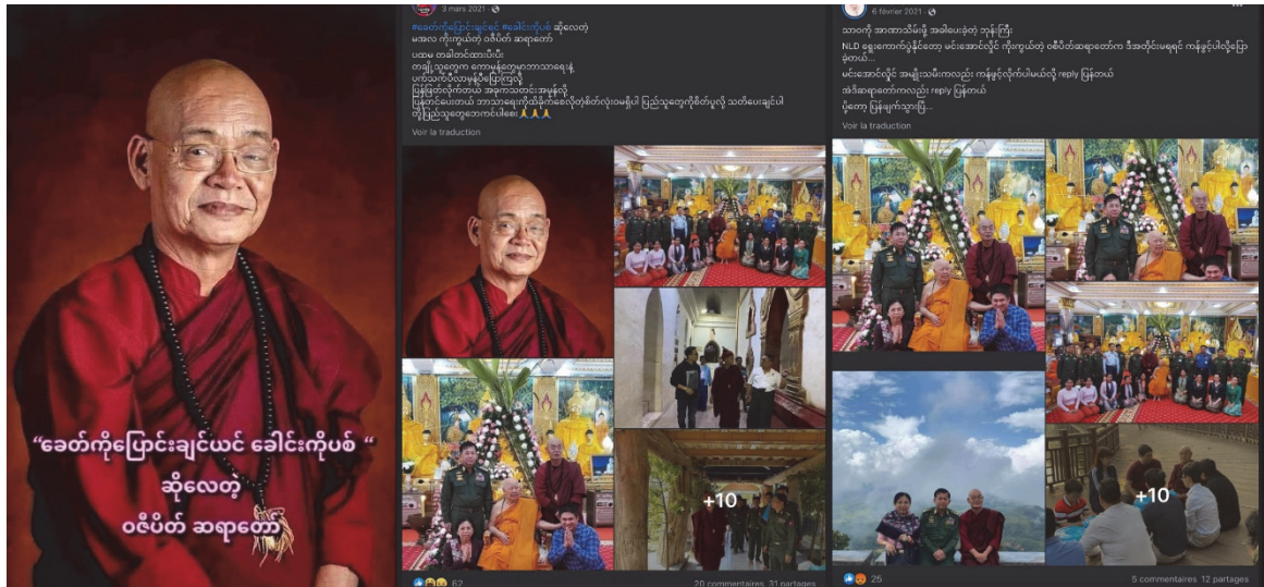
Figure 1 : Des posts Facebook médiatisant le moine Kovida, connu sous le nom de Wasipeik Hsayadaw, proche conseiller de Min Aung Hlaing et de sa famille (février-mars 2021). Le portrait à gauche est légendé : « si vous voulez changer d'époque, tirez dans les têtes, a déclaré le Wasipeik Hsayadaw ».