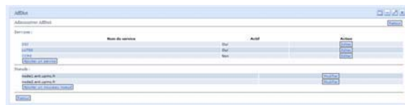
Interface administrateur AffDist