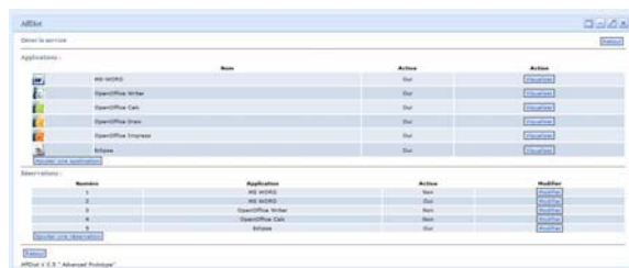
Interface administrateur d'un service

Noter la barre de disponibilité de l'application selon la charge du serveur