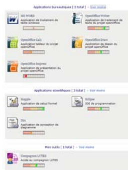
Affichage de toutes les applications (vue complète)

Noter la barre de disponibilité de l'application selon la charge du serveur