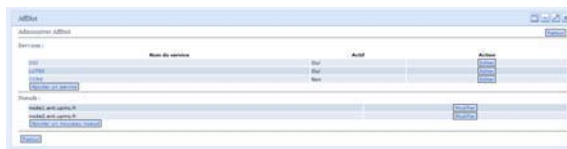
Interface administrateur AffDist