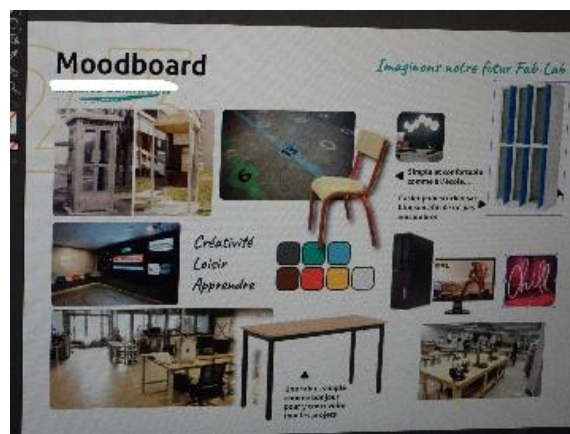
Figure 1- - Moodboard Mathis A., 12/09/23

Tant dans le rapport à l'outil qu'à la matière, si au niveau individuel, le sensoriel apparaît ainsi comme un déclencheur de créativité, installant « une relation nouvelle avec ses propres sensations » (Joas, 1999 ; Granjon, 2015), dans le même