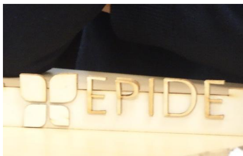
Figure 6 – Signalétique ÉPIDE aboutie, 25/01/24

Au-delà de l'instrumental et de l'organisé, les observations donnent à voir différents modes d'être et d'agir avec les outils, les objets, les matériaux, dépendant des acteurs, des moments, des situations, avec des arrangements en continu, le sens se construisant dans les interactions. Derrière la relation à la technique et aux outils, s'expriment un souci des choses et la force critique de la sensibilité ; il s'agit de créer de beaux objets, inédits, qui « se démarquent » (« on ne voit pas ça partout ») (figures 4, 5, 6), en y mettant une « touche personnelle » (Morad, entretien). Les outils et matériaux sont choisis en fonction de leurs dispositions (dimension projective, création d'univers...) ; et les matériaux utilisés, voire bricolés compte tenu de leur pouvoir d'évocation (qualité, texture...) ou même détournés, laissant parler les imaginaires, pour les faire correspondre aux idées à représenter.