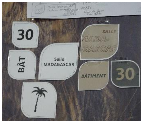
Figure 5 – Essais signalétique, en action 18/10/23