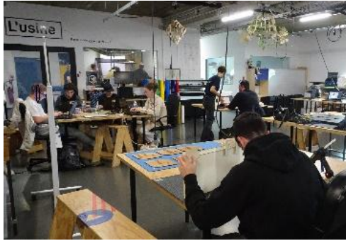
Figure 3 – Prototypage, bricolage, 17/10/23