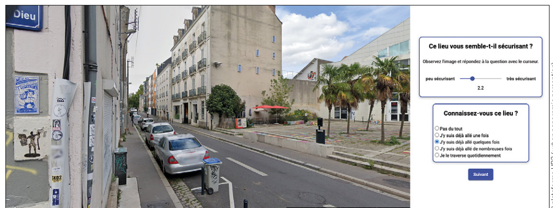
Capture d'écran de la plateforme UP2 ( urban panoramic perception ), développée par les auteurs pour collecter l'avis de participants sur des images Street View plates ou à 360°.