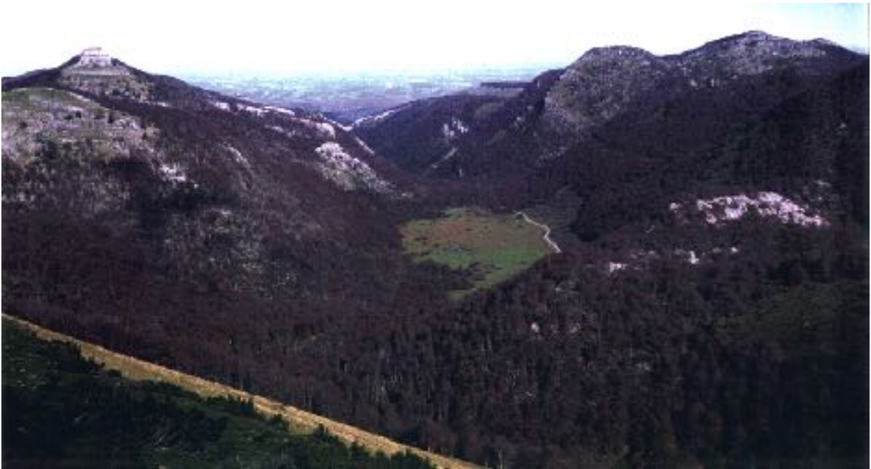
Figure 3 - Le massif des Arbailles forment un premier étage montagneux qui domine au nord l'avant pays (collines du flysch). Le poljé fossile d'Elsarré constitue un niveau caractéristique (700 m d'alt.), rapporté au Pléistocène moyen. Il est entaillé à l'aval par la reculée de la Bidouze contemporaine de la dernière phase de surrection (+450 m). À gauche, la butte résiduelle du Zabozé culmine à 1 178 m.