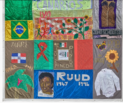
Bloc 23 du mémorial néerlandais du patchwork des noms, 2008 Matières textiles, 380 x 380 cm. Mucem, 2018.76.1

Présentation Audios / vidéos Activités Partenaires et mécènes