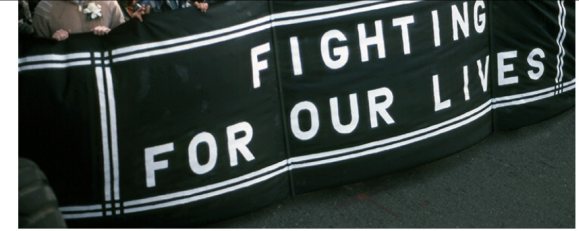
Jean-Baptiste Carhaix, Première manifestation de personnes atteintes par le VIH/sida, San Francisco, au carrefour Castro Street et Market Street, 2 mai 1983 ©Jean-Baptiste Carhaix