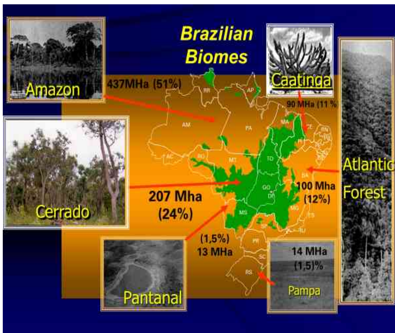
Figure 1. Répartition spatiale et quantitative des six principaux biomes brésiliens.

faciliter leur commercialisation, le gouvernement a retiré leurs prérogatives à l'Agence nationale de sécurité sanitaire (Anvisa) et à l'Institut brésilien de l'environnement et des ressources naturelles renouvelables (Ibama), laissant au seul ministère de l'Agriculture et de l'Élevage l'autorisation des produits phytosanitaires.