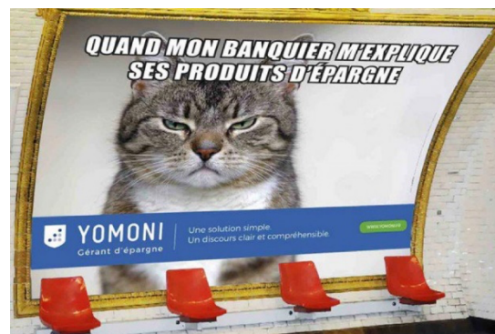
Figure 4 Publicité de Yomoni - 2

Le mème internet 8 est constitué de deux parties : une image et un texte. Ces deux publicités de Yomoni (une société de gestion d'investissements) sont des mèmes. Dans le premier mème, l'image d'un garçon qui fait preuve d'étonnement est censé corroborer l'effet provoqué chez le locuteur après la lecture « Quand je découvre que certains font gérer leur épargne sans être millionnaires » ; dans le second, l'image du visage d'un chat acariâtre est censée interagir avec le sens de la proposition « Quand mon banquier m'explique ses produits d'épargne ».