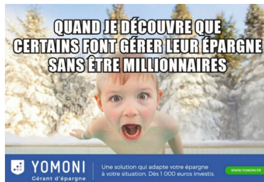
Figure 3 Publicité de Yomoni - 1

Proche du mot « mimétisme », le terme « mème », formulé par R. Dawkins (2003), désigne un processus d'imitation qui se répète entre les humains. J.S. Wilkins (1998 : 8) le définit ainsi : « A meme is the least unit of sociocultural information relative to a selection process that has favourable or unfavourable selection bias that exceeds its endogenous tendency to change ». Les réseaux sociaux de nos jours facilitent grandement la propagation des mèmes.