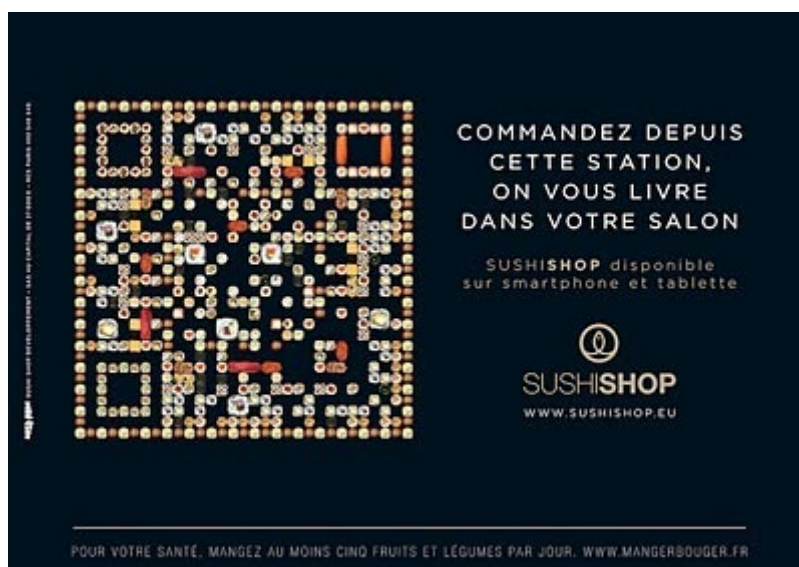
Figure 1 Affiche publicitaire de SushiShop