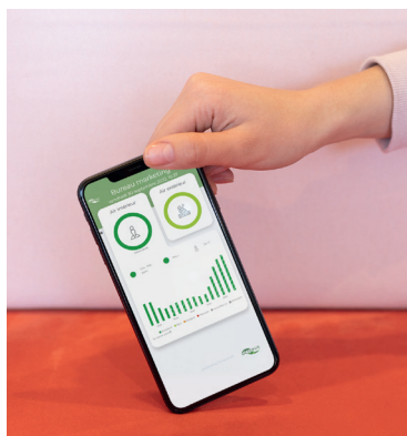
Application INDALO® utilisée par Octopus Lab pour la surveillance de la qualité de l'air intérieur.