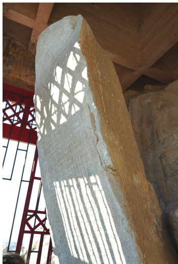
图5 天柱山《郑文公上碑》