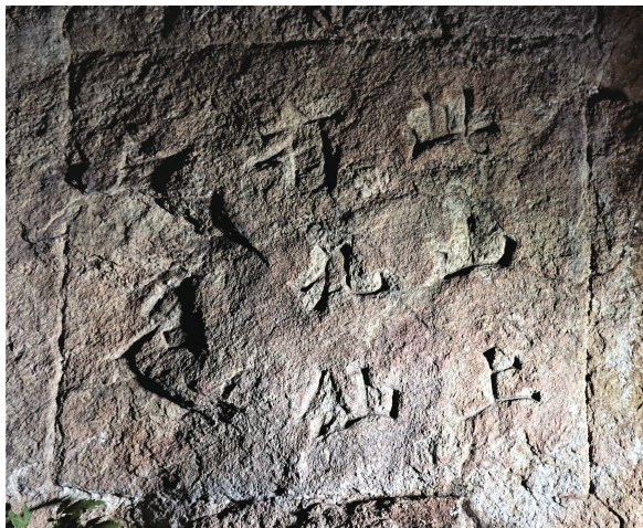
图 11 云峰山“九仙之名”刻石（夜晚）