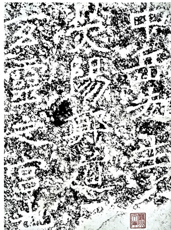
图 15 大基山“玄灵宫”拓片