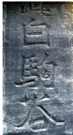
图 16 玲珑山“此白驹谷”刻石（图片来源：作者现场拍摄，2015-03-23）