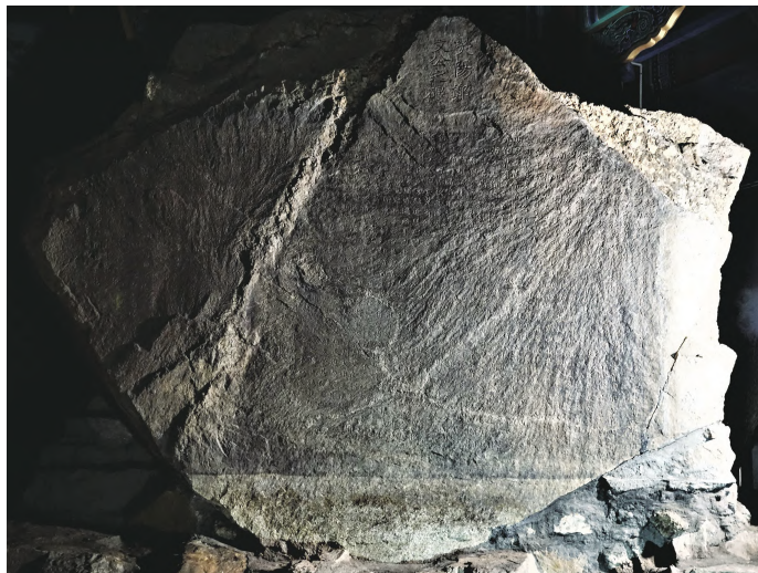
图7 云峰山《郑文公下碑》(夜晚)

迁秘书监, 蒙阳邑中正。出为平东将军、光州刺史, 转青州刺史, 将军如故。复入为秘书监, 加平南将军。熙平元年卒, 赠镇北将军、相州刺史、谥曰文恭。