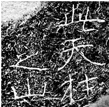
图9 天柱山“此天柱之山”拓片