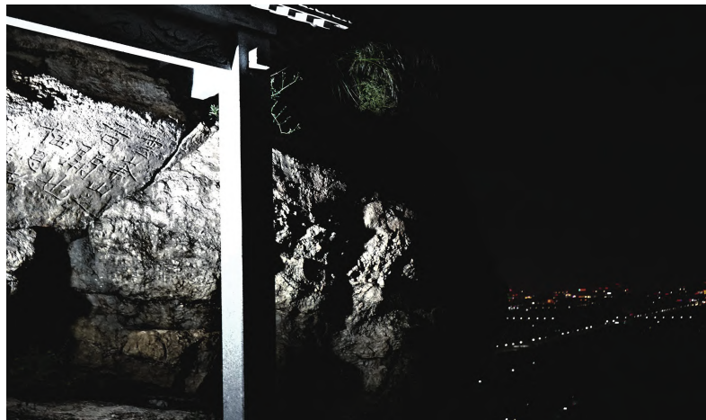
图 14 云峰山“右阙”刻石（夜晚）（图片来源：作者现场拍摄，2020-08-29）