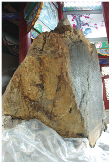
图6 云峰山《郑文公下碑》