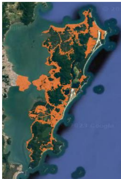
Figura 2 - Mancha urbana em 2019.