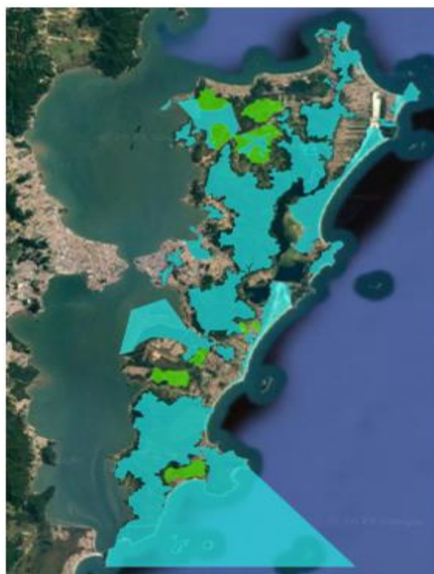
Figura 8 - Sobreposição das Unidades de Conservação, em azul, com as AUC, em verde.