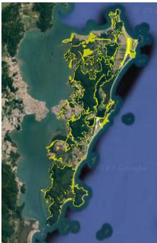
Figura 3 - Croqui com a delimitação das Zonas de Interesse de Proteção.

Isto é, a legislação delimita áreas (figura 3) que, dentre outras funções, servem para dar suporte aos riscos decorrentes das mudanças do clima. Algo interessante a ser observado é que as áreas identificadas como ZIP estão próximas ou margeiam Unidades de Conservação (figura 4), espaços que já possuem regras específicas de utilização e proteção. Assim sendo, pouco se adicionou, em termos de área, como Zonas de Interesse de Proteção.