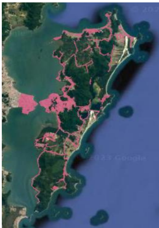
Figura 1 - Mancha urbana em 1977.

Fonte: Adaptado pelos autores a partir dos dados cartográficos do Plano Diretor, 2024.