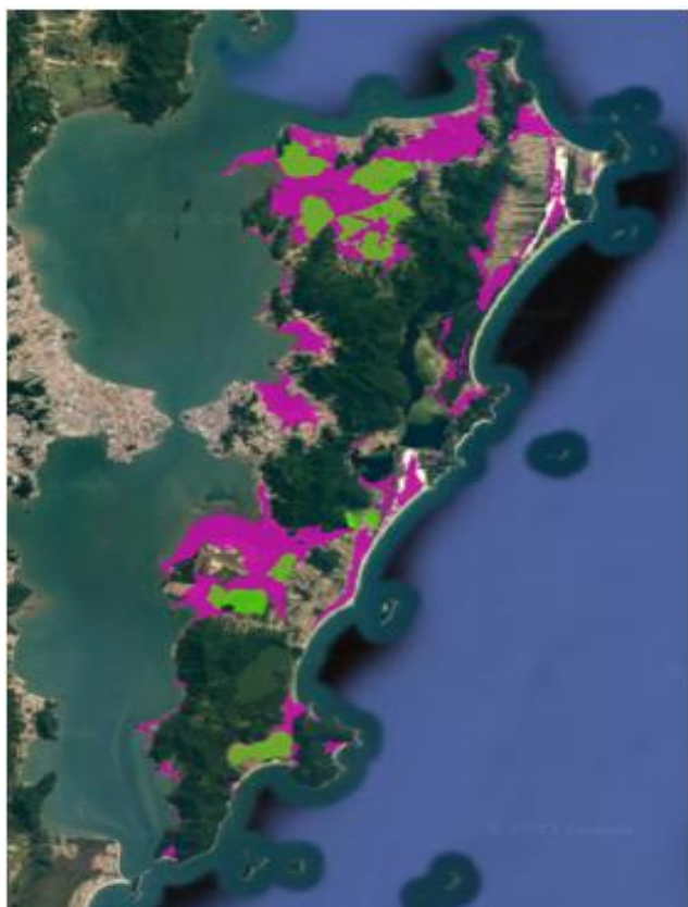
Figura 7 - Sobreposição das áreas com risco de inundação, em rosa, com as AUC, em verde.

sobrepostas às Unidades de Conservação (figura 8), o que pode futuramente provocar pressão sobre essas áreas, que possuem inestimada importância para a sociedade e à conservação ambiental no município.