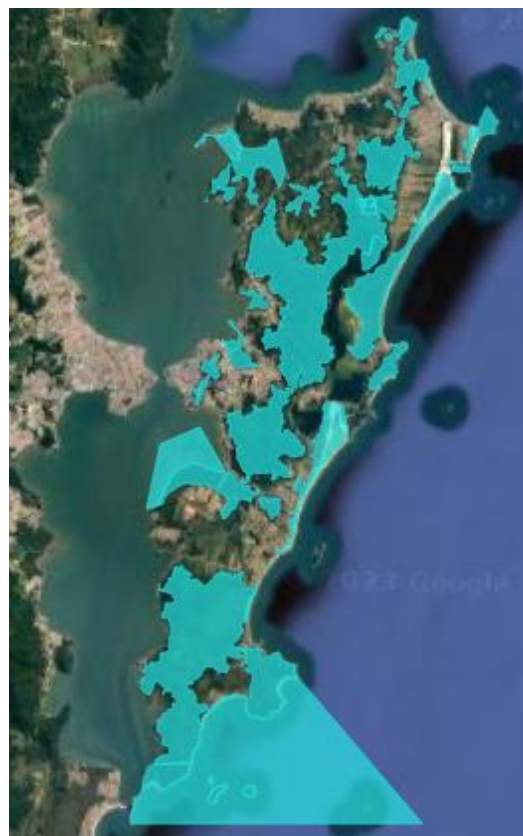
Figura 4 - Croqui com a delimitação das Unidades de Conservação.