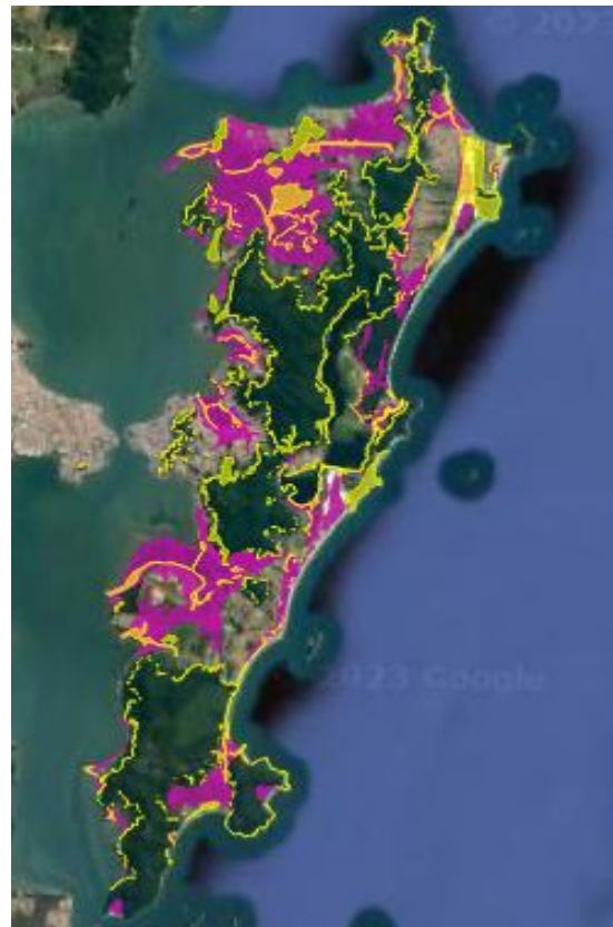
Figura 6: Sobreposição da ZIP, em amarelo, com áreas sujeitas à inundação, em rosa.