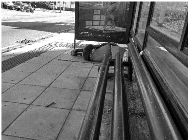
Figura 4: Arquitetura hostil em Florianópolis