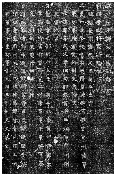
◎ 图3 郑穆姬墓志（局部）

出嫁仪式：“高祖（孝文帝元宏，467—499）盛简嫔嬙，纳为淑媛。（488年）乃遣其次兄文恭公，就兖州迎/送。时年十五，声冠后宫，以有名家之风，故雅见知重。”