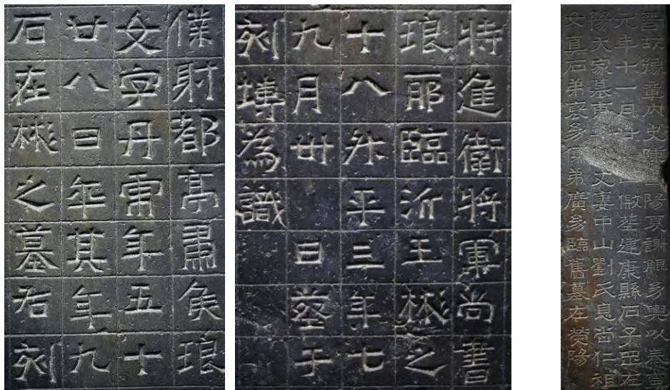
◎ 图4 王丹虎墓志（局部） 南京六朝博物馆藏