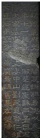
◎ 图5 谢琨墓志 南京六朝博物馆藏

古意。而且，由于每个字都较为独立，让字之间呈现出“等距化”，而使得章法呈现出疏朗明了的感觉，如同四方连续的纹样，在重复之中显现出视觉的均衡效果。