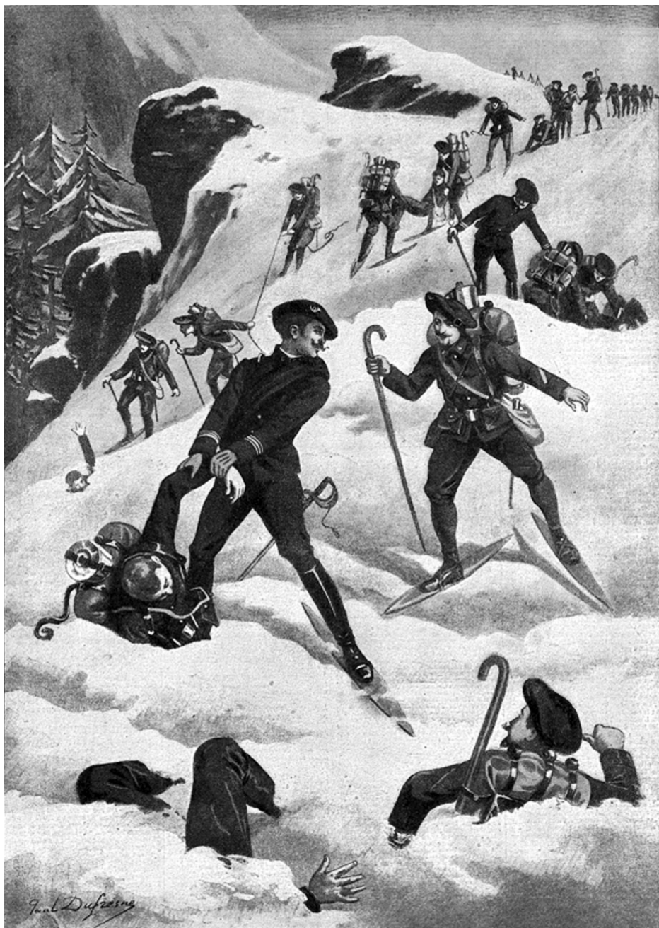
Fig. 3: Sauvetage en skis.