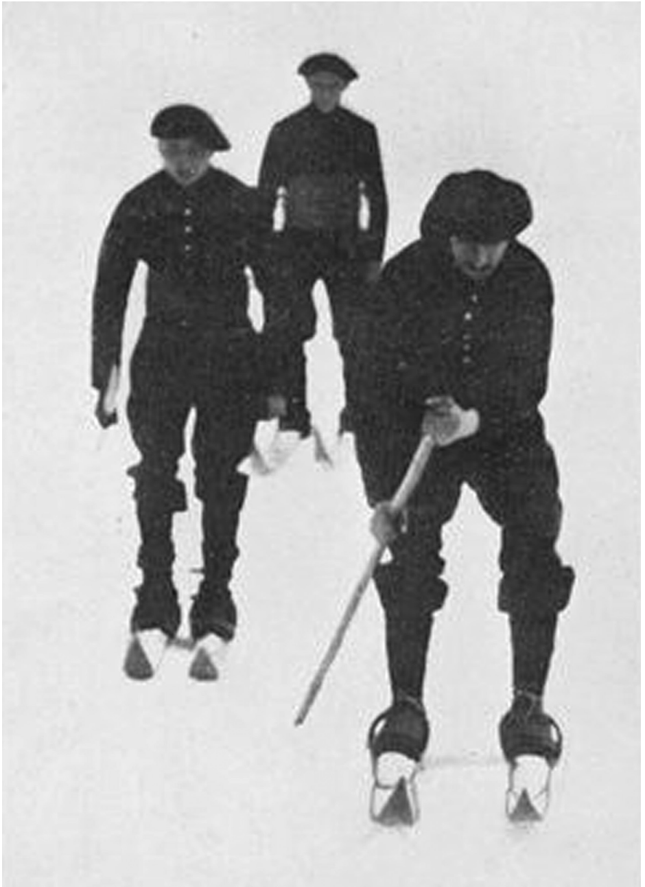
Chasseurs alpins réalisant une descente à ski. Légende : Les sports modernes illustrés , 1905, BNF.