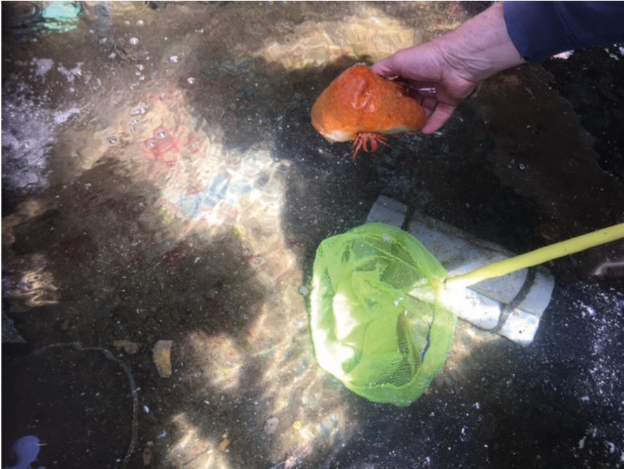
Fig. 2. Pêcheur montrant une symbiose entre une suberite et un bernard l'hermitte.

Dans les entretiens, cette définition de la mer comme milieu de vie pour des espèces animales et végétales ne s'accompagne pas nécessairement d'un discours sur sa fragilité. En fait, le vivant marin peut faire l'objet de deux types de discours : pour certains, il est en danger de disparition ; pour d'autres, il a à l'inverse bénéficié des mesures de protection mises en place par les autorités, et se porte beaucoup mieux que par le passé. Ces positionnements antagonistes révèlent un certain clivage quant aux représentations de l'« état » écologique de la mer Méditerranée avec, d'un côté, ceux qui la trouvent dégradée et, de l'autre, ceux qui insistent sur sa résilience.