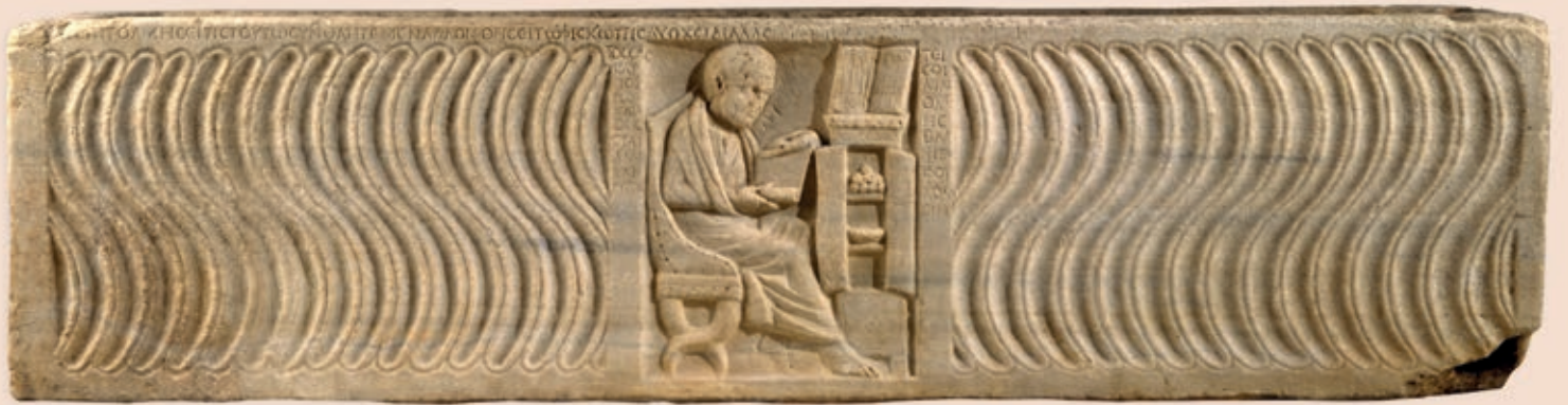
Bas-relief d'un sarcophage du 4 e siècle, montrant un médecin lisant devant un armarium (coll. New York, The Metropolitan Museum of Art)