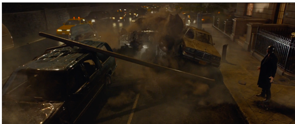
Fig. 4 : X-Men: Dark Phoenix , photogramme de l'attaque de Magneto (01:14:09).

de caractériser le personnage plutôt que de l'identifier musicalement : le matériau musical en lui-même étant secondaire, seule la texture agit comme indice du niveau des pulsions de violence du supervilain ou de la tension de la scène dans laquelle il est impliqué.