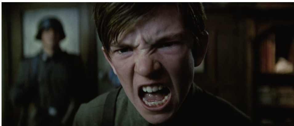
Fig. 2 : X-Men: First Class , photogramme du hurlement d'Erik, après le meurtre de sa mère par Sebastian Shaw (08:04).

la mort de sa mère 1 . Musicalement, Henry Jackman met en valeur Magneto par un thème qui, on l'a vu, prend sa source dans le motif imaginé par Ottman pour Wolverine. Ce thème repose sur peu d'éléments musicaux : deux accords alternés, des battements de cordes en accompagnement et une mélodie réduite à quatre notes (ex. 6) 2 . Loin d'être une faiblesse, cette grande forte concision permet à Jackman de décliner son thème dans des styles très variés, allant d'un underscoring ascétique (guitare électrique discrète, ponctuations de cordes) à des moments de toute-puissance où le thème explore des registres metal (scène de la colère du jeune Erik, après l'assassinat de sa mère) ou électro (générique de fin, avec le cue « Magneto »).