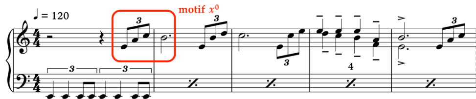
Ex. 3 : X-Men , le Professeur Xavier quitte la prison de Magneto (01:34:52-01:35:02). Réduction mélodique réalisée à partir du film.

ou Danny Elfman ( Batman , 1989) – un amélodisme qui préfigure en un sens les évolutions d'une partie des musiques de blockbusters hollywoodiennes, notamment sous l'impulsion de Zimmer. Cette approche plus motivique que thématique 1 est renforcée par l'organicité du matériau développé par Kamen : au motif x^1 , il est possible d'opposer un motif x^0 associé aux mutants du Professeur Xavier.