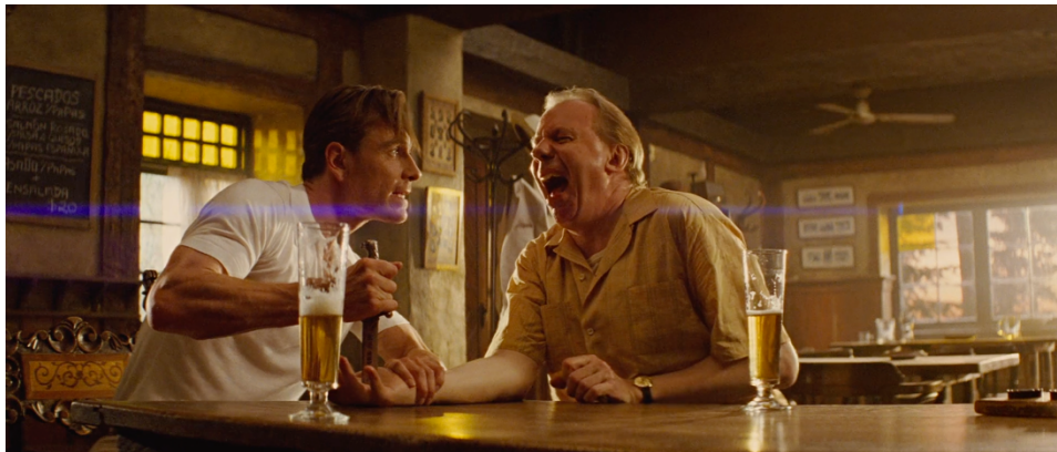
Fig. 3 : X-Men: First Class , photogramme de la scène d'exécution des nazis avec lens flare visible (24:51).