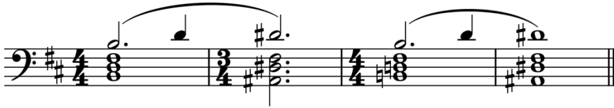
Ex. 5 : X-Men 2 , souvenir de Wolverine (1:32:22-1:32:33). Réduction réalisée à partir du film.

réassignation illustre une donnée centrale qui s'impose à tous les compositeurs de cinéma, bien au-delà de la question des franchises : dans l'appréhension d'un film par des spectateurs comme par des analystes, des considérations réceptives et herméneutiques menacent à chaque instant l'autorité prétendue des créateurs sur leur œuvre, d'autant que des processus industriels et humains complexes bousculent sans cesse les contours de ces projets en plusieurs épisodes. Le rétablissement de l'association de Wolverine à son motif originel dans Days of Future Past semble donc ajouter de la confusion à la situation, d'autant qu'il y est ramené à son statut initial de motif extrêmement secondaire.