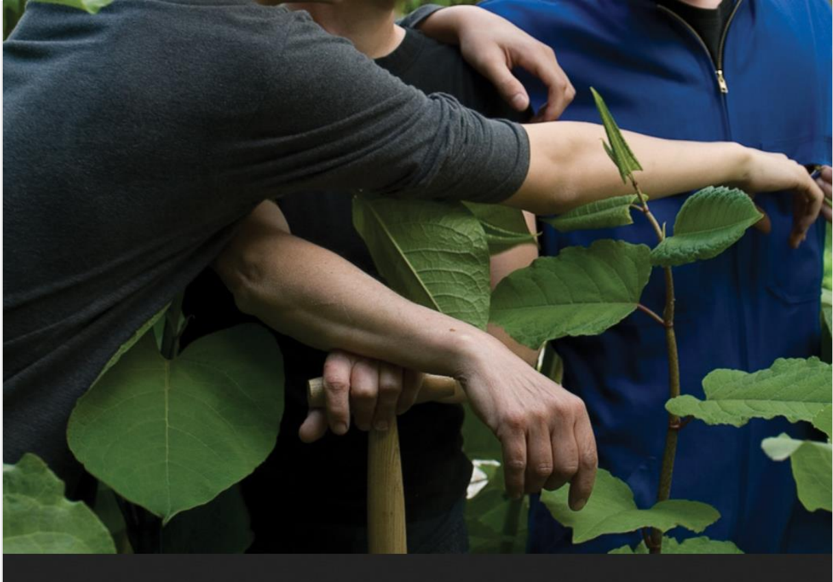
« La famille des Polygonum », Collection nationale de Polygonum créée par l'artiste botaniste Liliana Motta au jardin Les Hautes Haies, à Saint-Paul-le-Gaultier (Sarthe) © L. Motta.