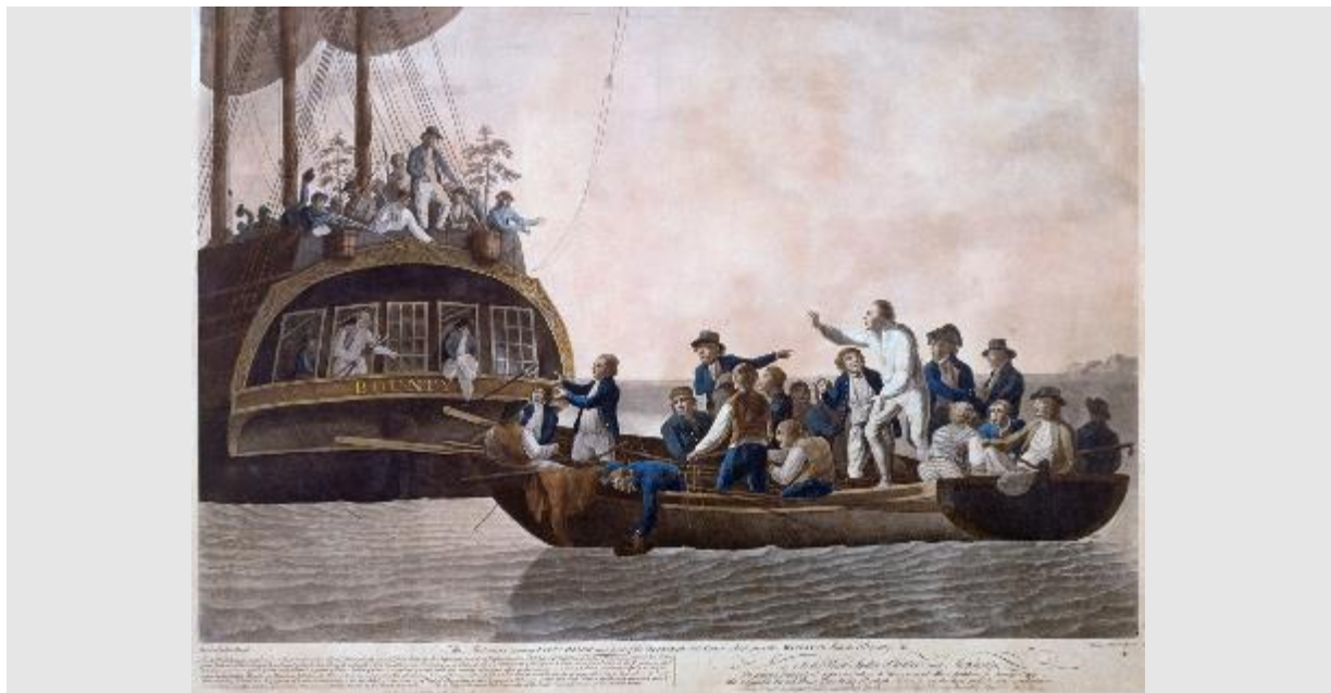
Robert Dodd, The mutineers turning Lieut Bligh and some of the officers and crew adrift from His Majesty's Ship Bounty, 29 avril 1789, gravure, 1790. Greenwich, National Maritime Museum

Depuis des temps immémoriaux, chaque civilisation a pris l'initiative de faire migrer certaines plantes selon ses besoins et en fonction de ses expériences. Par exemple, les navigateurs polynésiens ont importé la patate douce ( Ipomea batatas ) d'Amérique du Sud autour de l'an mil, ce qui explique peut-être la similarité de son nom dans les langues polynésiennes ( kumara ) et quechua ( kumar ). À partir de cette première impulsion, la patate douce s'est répandue dans le monde entier, devenant par exemple un aliment majeur en Papouasie-Nouvelle-Guinée.