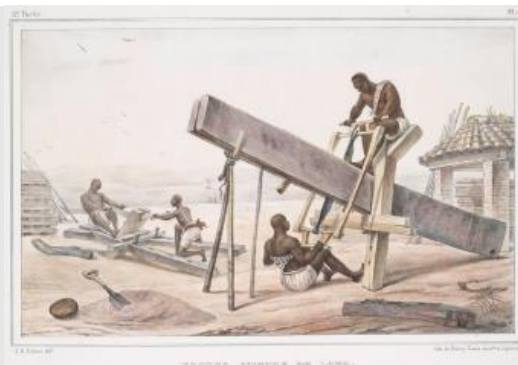
Jean Baptiste Debret, « Nègres scieurs de long », Voyage pittoresque et historique au Brésil depuis 1816 jusqu'en 1831, ou Séjour d'un artiste français au Brésil, Paris, Firmin Didot, 1834-1839