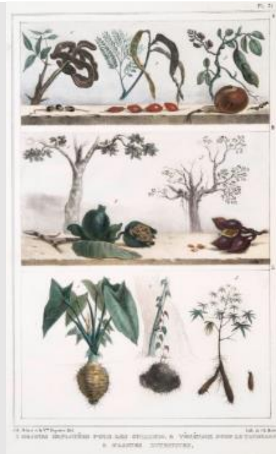
Jean Baptiste Debret, « 1. Graines employées pour les colliers ; 2. Végétaux pour le tatouage ; 3. Plantes nutritives », Voyage pittoresque et historique au Brésil depuis 1816 jusqu'en 1831, ou Séjour d'un artiste français au Brésil, Paris, Firmin Didot, 1834-1839

Les principales plantes voyageuses sont les graminées, les légumineuses et les fruitiers, ainsi que celles fournissant les épices. Outre les végétaux comestibles furent transportées des espèces utiles pour la construction, l'industrie, la teinture et la décoration, ou pour la préparation des remèdes, et pour les rituels religieux. Les plantes domestiquées furent privilégiées, mais des plantes sauvages ont également été déplacées, comme certaines lavandes spontanées. Des espèces d'arbre non domestiquées, tel le baobab Adansonia digitata , ont été introduites en Inde depuis l'Afrique il y a plus de mille ans par des marchands et voyageurs du monde musulman – ce baobab est d'ailleurs dénommé papapuli dans le sud de l'Inde, terme tamoul signifiant « tamarinier de l'extérieur ».