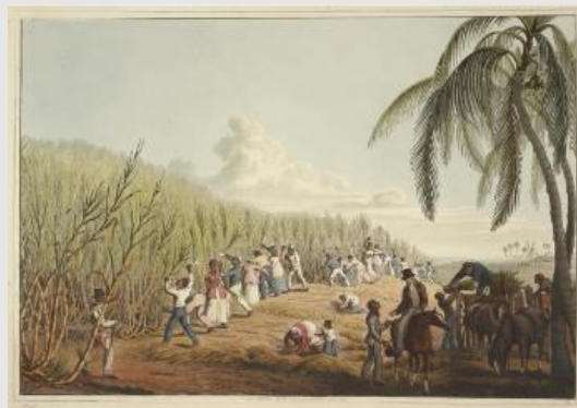
William Clark, « Slaves cutting the sugar cane », Ten Views in the Island of Antigua , Londres, Thomas Clay, 1823, planche IV

Le peintre, qui a séjourné en Martinique, sacrifie ici le réalisme à une esthétique rococo, montrant des esclaves oisifs dans un paysage luxuriant où l'on distingue des plantes de l'Amérique tropicale (calebassier, anacardier, inga, palmiers) et une autre importée (canne à sucre, originaire d'Asie). La femme sert une boisson (chocolat ? café ?), tandis que l'homme au premier plan porte une machette évoquant le travail agricole.