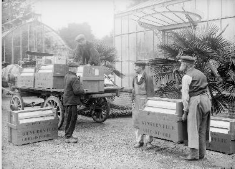
« Expédition de plantes au Jardin colonial de Nogent-sur-Marne à destination des jardins d'essais », 1909. Plaque de verre noir et blanc ; 13 × 18 cm. Paris, Bibliothèque nationale de France

Les plantes conditionnées en serres portatives (caisses de Ward) étaient destinées aux jardins d'essais coloniaux de Bingerville en Côte d'Ivoire, de Saint-Louis au Sénégal et de Papeete à Tahiti.