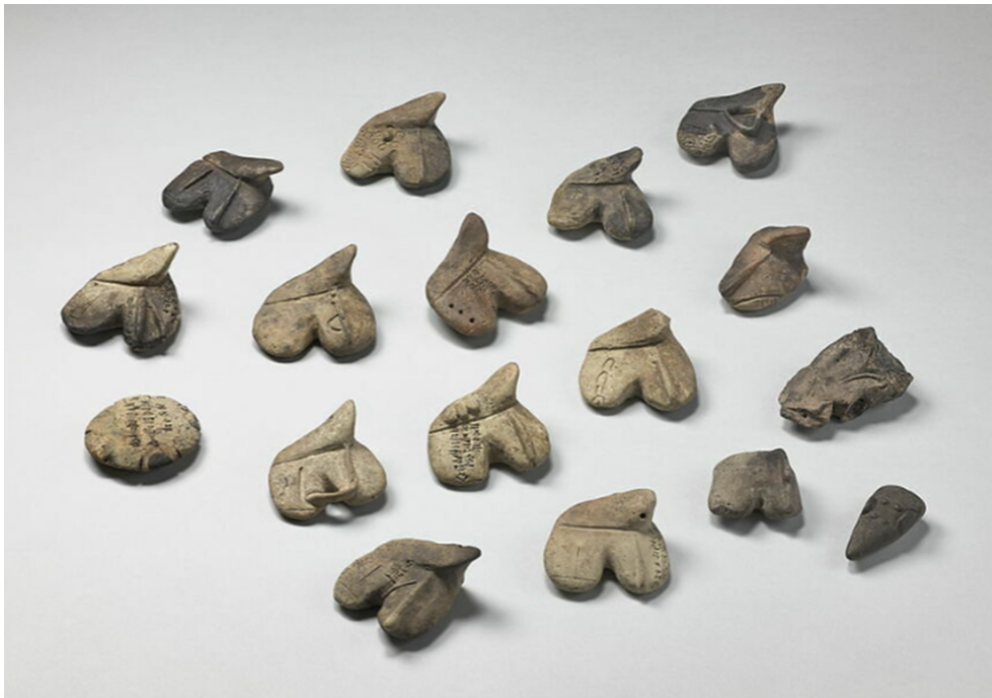
Fig. 8 : Modèles de foies et d'une rate divinatoires en argile XIX e – XVIII e s. av. J.-C. Mari, palais (salle 108)

Ces foies et cette rate miniatures reproduisaient l'organe qui avait été observé par le devin, avec le signe omineux qui y était inscrit (c'est-à-dire la malformation, les marques, ou les changements de couleurs que les dieux avaient inscrits sur l'organe). Ce signe était accompagné d'une inscription décrivant la prédiction associée.