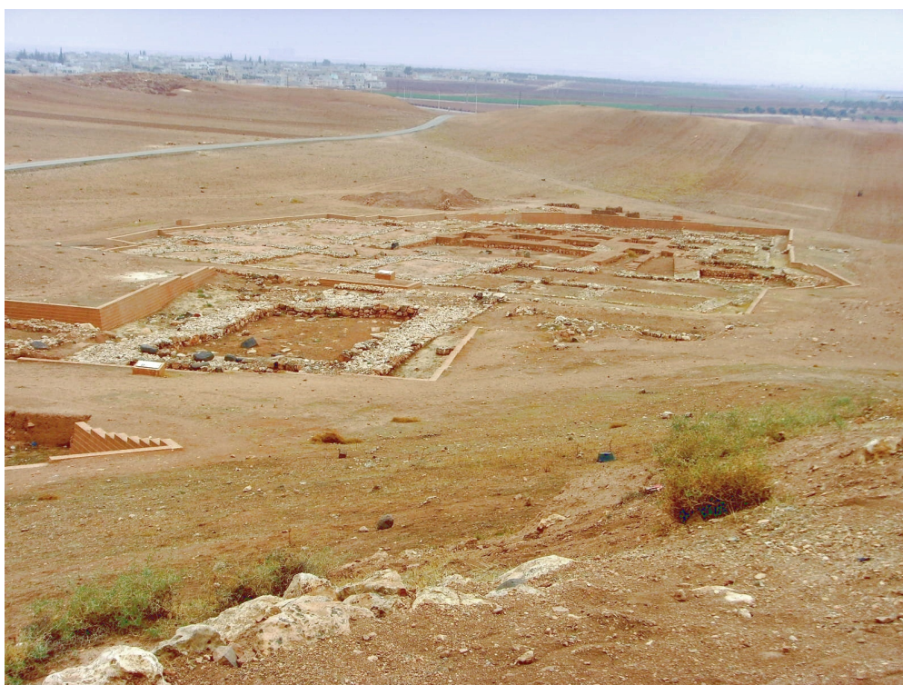
Fig. 7 : Vue du site archéologique d'Ebla, notamment du palais et d'un temple

Les étudiants de 2 e année ont quant à eux suivi un cours dédié à l'archéologie du Levant : après une introduction sur le cadre géographique, historique et sur l'histoire de la recherche archéologique dans cette région, plusieurs thèmes ont été traités. Le Levant depuis la révolution néolithique et le passage vers le Chalcolithique est illustré par des études de cas sur la culture matérielle, les pratiques funéraires et l'architecture. Ensuite, un autre grand thème portait sur l'urbanisation et le III e millénaire, avec pour exemples des grands sites comme Ebla (fig. 7) et des villages agricoles comme Tell Arqa.