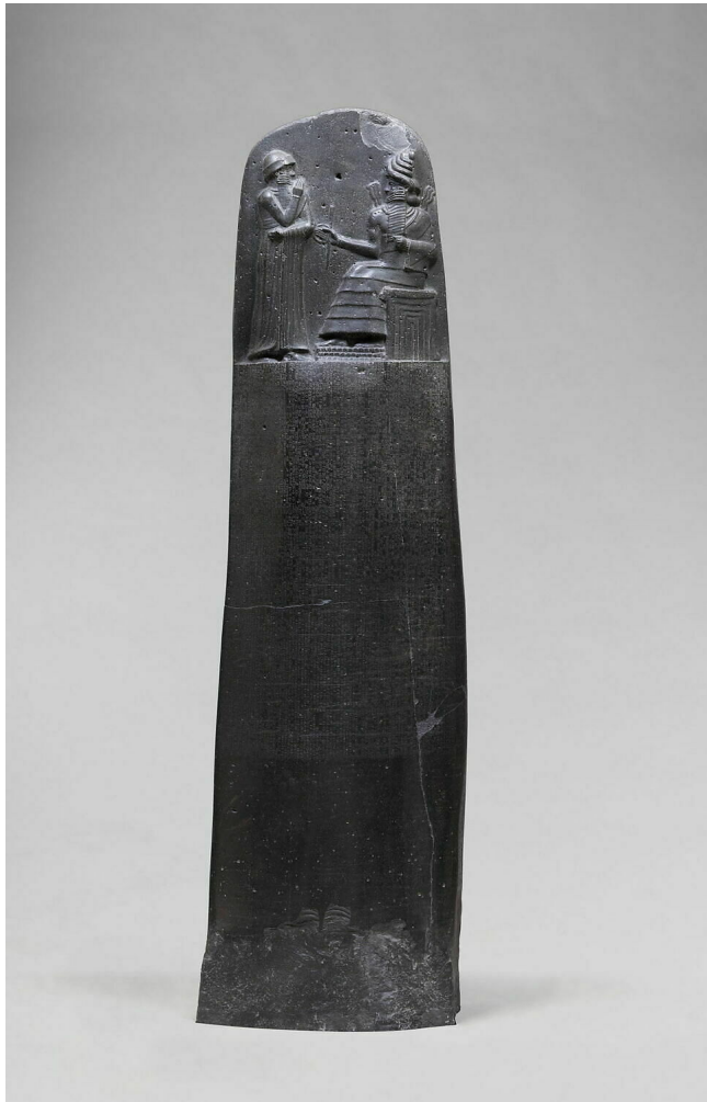
Fig. 3 : Stèle du code de lois de Hammu-rabi (18 e s. av. J.-C.)

L'épilogue présente le roi et résume son œuvre de justice, avant de la placer sous la protection des dieux au moyen de malédictions développées (qui seront étudiées l'année prochaine) :