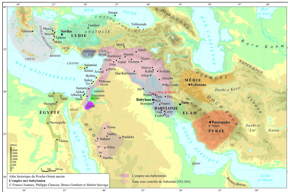
Fig. 5 : Carte du Proche-Orient ancien durant la période néo-babylonienne © Sauvage 2021

Mais le règne de Nabuchodonosor II a aussi été une période de prospérité qui a permis de nombreuses constructions et reconstructions dans Babylone et dans toute la Babylonie : ces travaux de bâtisseur sont connus notamment par des inscriptions sur cylindres, comme celui-ci enregistrant la reconstruction de la ziggurat du dieu-Lune Sîn dans la ville d'Ur (fig. 6).