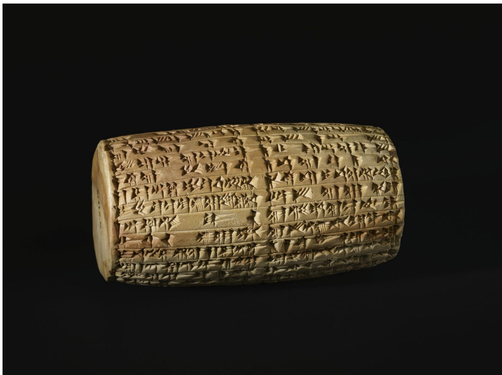
Fig. 6 : Cylindre du roi Nabonide enregistrant la reconstruction de la ziggurat de Sîn à Ur (BM 91125)

Mais le règne de Nabuchodonosor II a aussi été une période de prospérité qui a permis de nombreuses constructions et reconstructions dans Babylone et dans toute la Babylonie : ces travaux de bâtisseur sont connus notamment par des inscriptions sur cylindres, comme celui-ci enregistrant la reconstruction de la ziggurat du dieu-Lune Sîn dans la ville d'Ur (fig. 6).