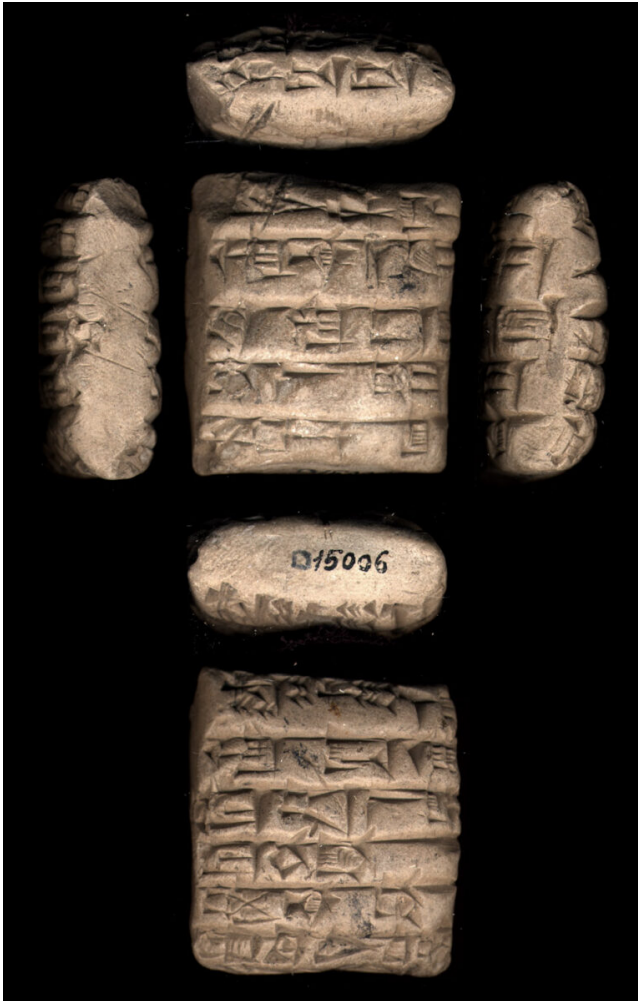
Fig. 1 : Lettre de la période d'Ur III (TCS 1 129)

fig. 1). Ces documents datent eux aussi de la période d'Ur III, qui est une période particulièrement riche ayant livré plusieurs dizaines de milliers de tablettes en argile (une partie des cours de sumérien de l'année prochaine traitera à nouveau de cette période, avec les DI.TIL.LA, des comptes-rendus de procès).