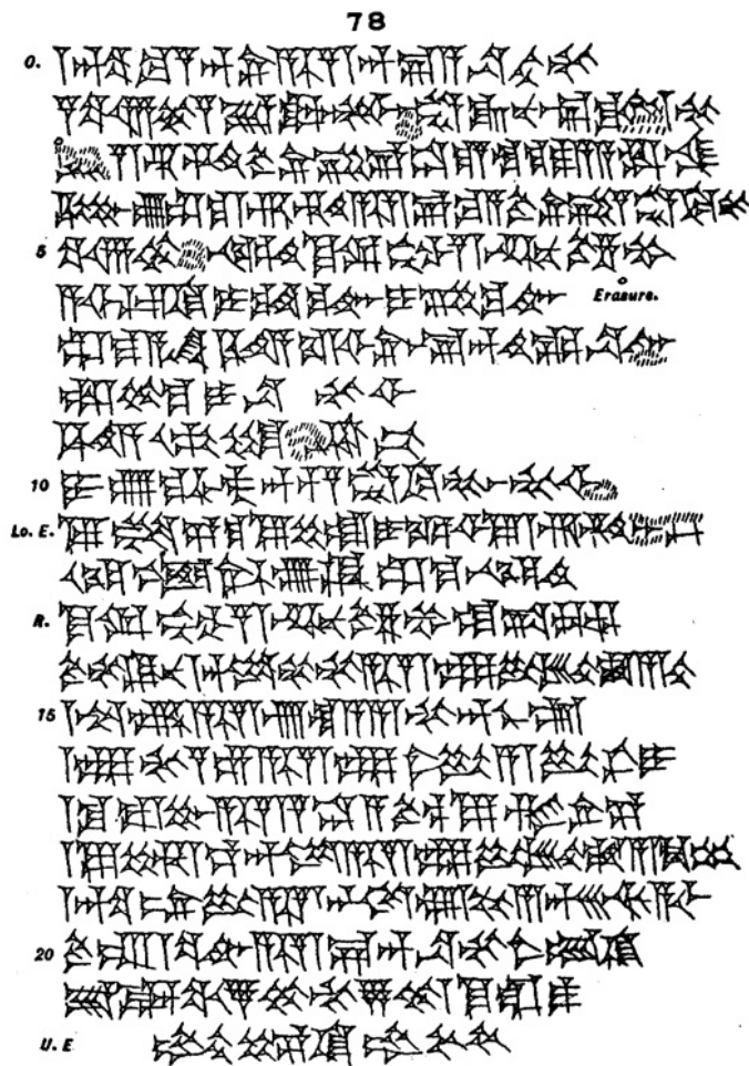
Fig. 4 : Copie d'une tablette de procédure judiciaire néo-babylonienne concernant un vol (YOS 7 78)

accusé d'un vol nocturne de laine à l'intérieur du temple, avec la complicité du portier : le texte contient l'enregistrement de ses aveux et la déclaration du portier (fig. 4).