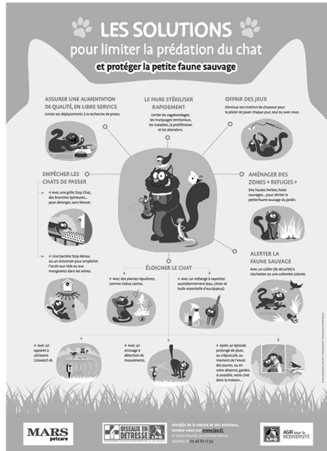
Fig. 4. Affiches incitant à stériliser les chats et à limiter leur prédation de la petite faune sauvage.