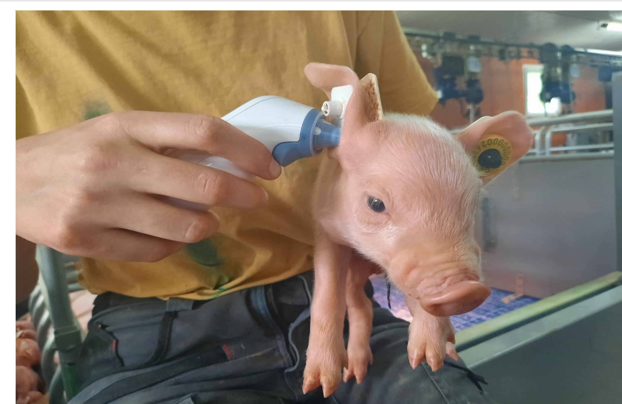
La température tympanique est mesurée avec un thermomètre Infra-Rouge (Thermoscan IRT 6520)