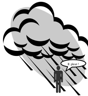
Figure 2 – Comment le locuteur en viendra-t-il à produire l'énoncé « Il pleut » ?

Compte tenu de la complexité des phénomènes liés au temps et à la négation, nous nous cantonnerons dans cet exposé à l'analyse de phrases simples envisagées dans une perspective référentialiste 6 . Voyons donc comment pourrait s'effectuer la production d'un message exprimant l'état du monde illustré dans la Figure 2 :