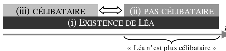
Figure 1 – « Léa n'est plus célibataire »

En somme d'un point de vue temporel, nous obtiendrions la représentation possible suivante d'un état du monde décrit par l'énoncé « Léa n'est plus célibataire » :