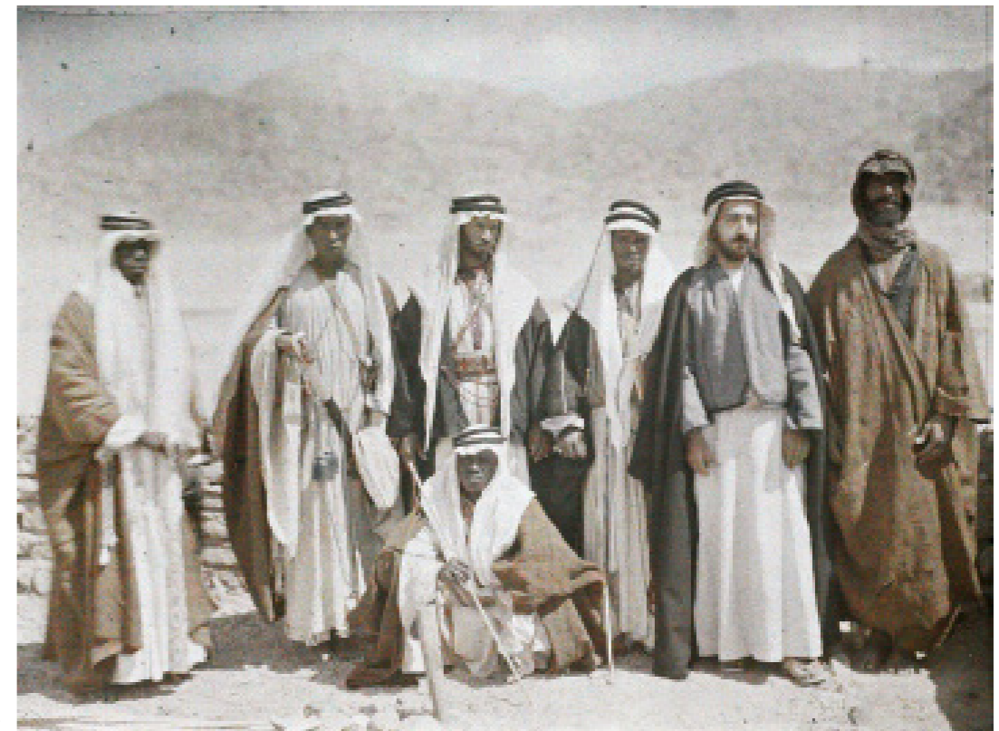
② p. 126

À partir de 1912, les opérateurs sont rassemblés à Boulogne, le plus souvent dans le bâtiment dévolu à la société Autour du Monde non loin de locaux qui accueillent le stockage des films, des autochromes et un laboratoire photographique 28 . C'est là aussi sous l'égide de Brunhes que les opérateurs préparent leurs missions, cartes à l'appui, choisissent les lieux et régions à visiter en priorité. Entre 1910 et 1931, les missions des Archives de la Planète couvrent 48 pays. L'apport scientifique de Brunhes s'incarne par cette volonté de cadrage d'un projet protéiforme aux contours relativement flous qu'Albert Kahn avait entrevu. Les missions réalisées entre 1909 et 1911 sont à ce titre expérimentales et l'impulsion est véritablement donnée à partir de la mise en place de la direction scientifique par Brunhes.