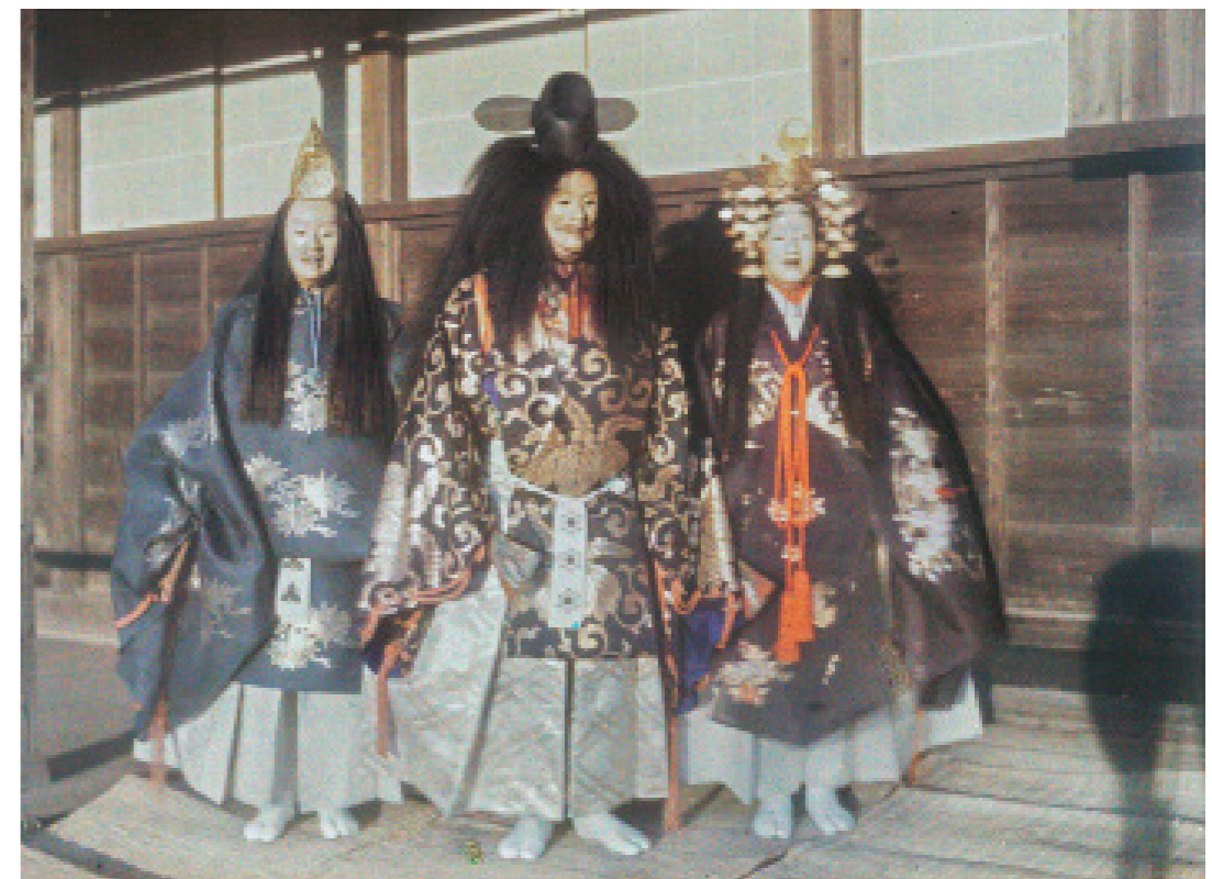
③ p. 138

Il demande d'ailleurs de manière obligatoire aux opérateurs de remplir des « fiches opérateurs » et des « fiches documentaires » destinées à un inventaire général des Archives. Ces fiches comportent des informations sur la date (parfois même l'heure pour justifier les effets de lumière), le lieu et le sujet des images. L'objectif affiché s'inscrit dans le champ du positivisme scientifique autour d'un désir encyclopédique de compulsions, de catégorisation et de mise en œuvre d'éléments en un même espace pour servir la connaissance humaine 29 .