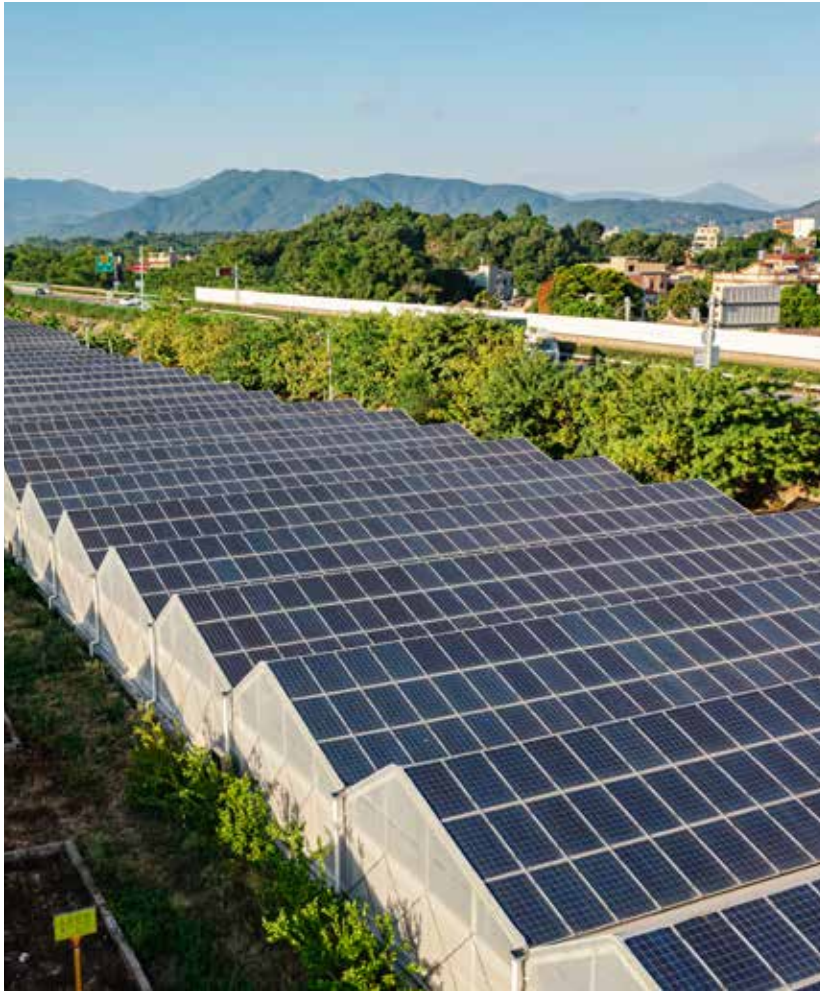
Panneaux photovoltaïques au-dessus d'une serre située en Chine