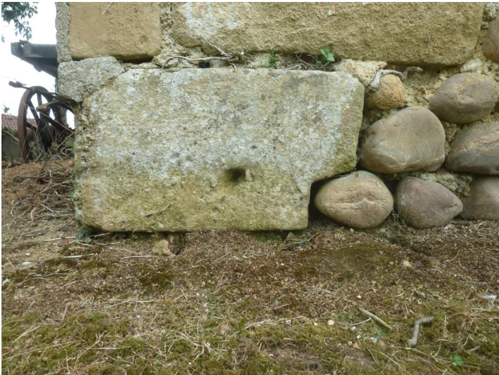
Fig. 20 : Église de Bastanous, élévation nord, détail de l'angle nord-est