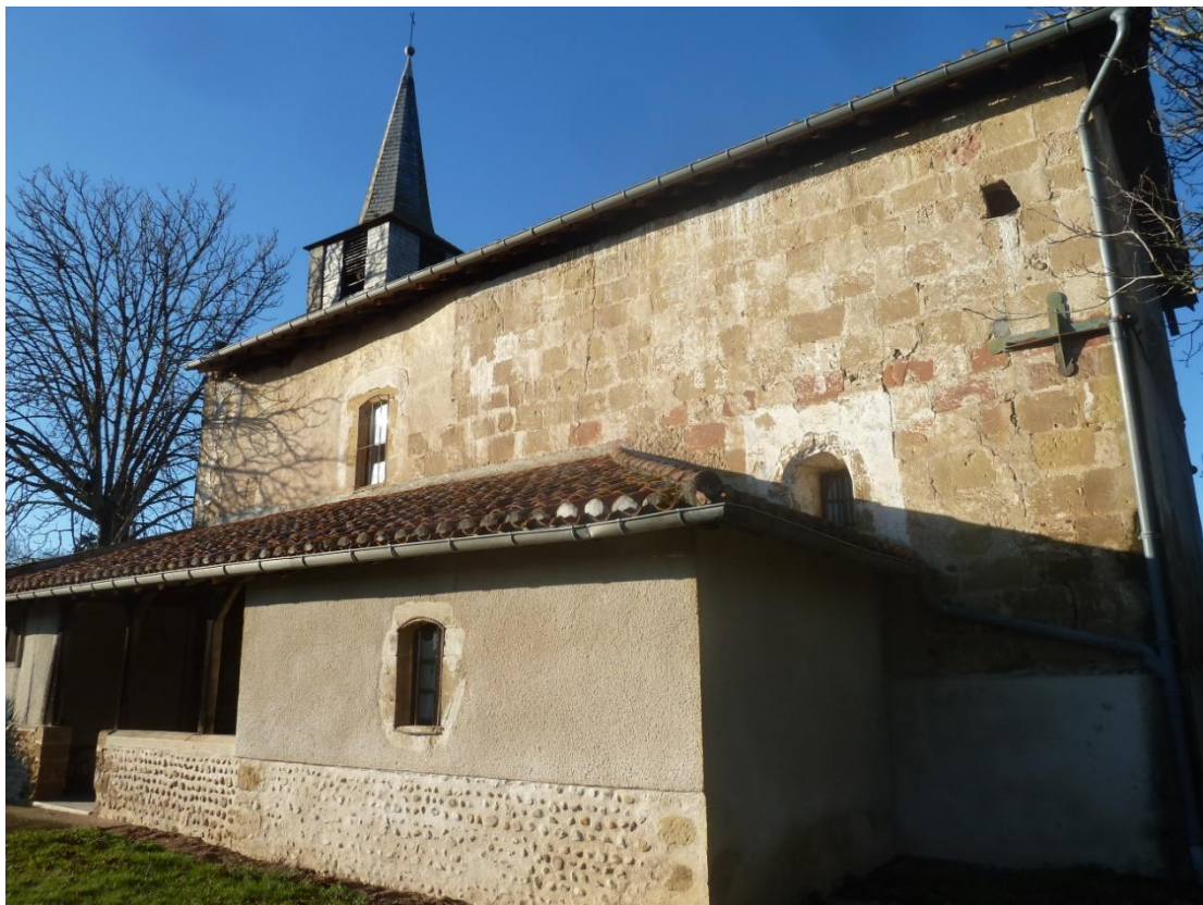
Fig. 24 : Église de Bastanous, vue depuis le sud-est (Cl. C. Balagna)