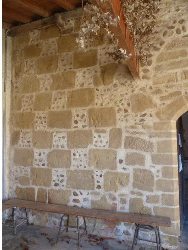
Fig. 27 : Église de Bastanous, élévation du mur sud, à gauche du portail