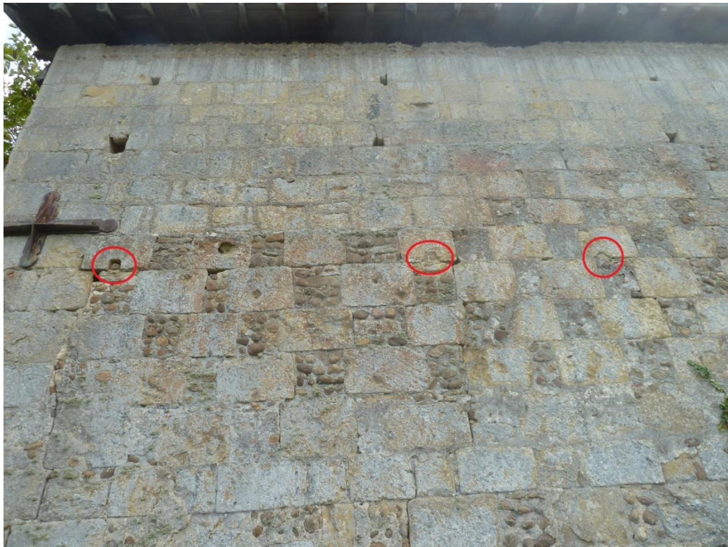
Fig. 22 : Église de Bastanous, élévation nord, les trous de boulin de la 13 e assise