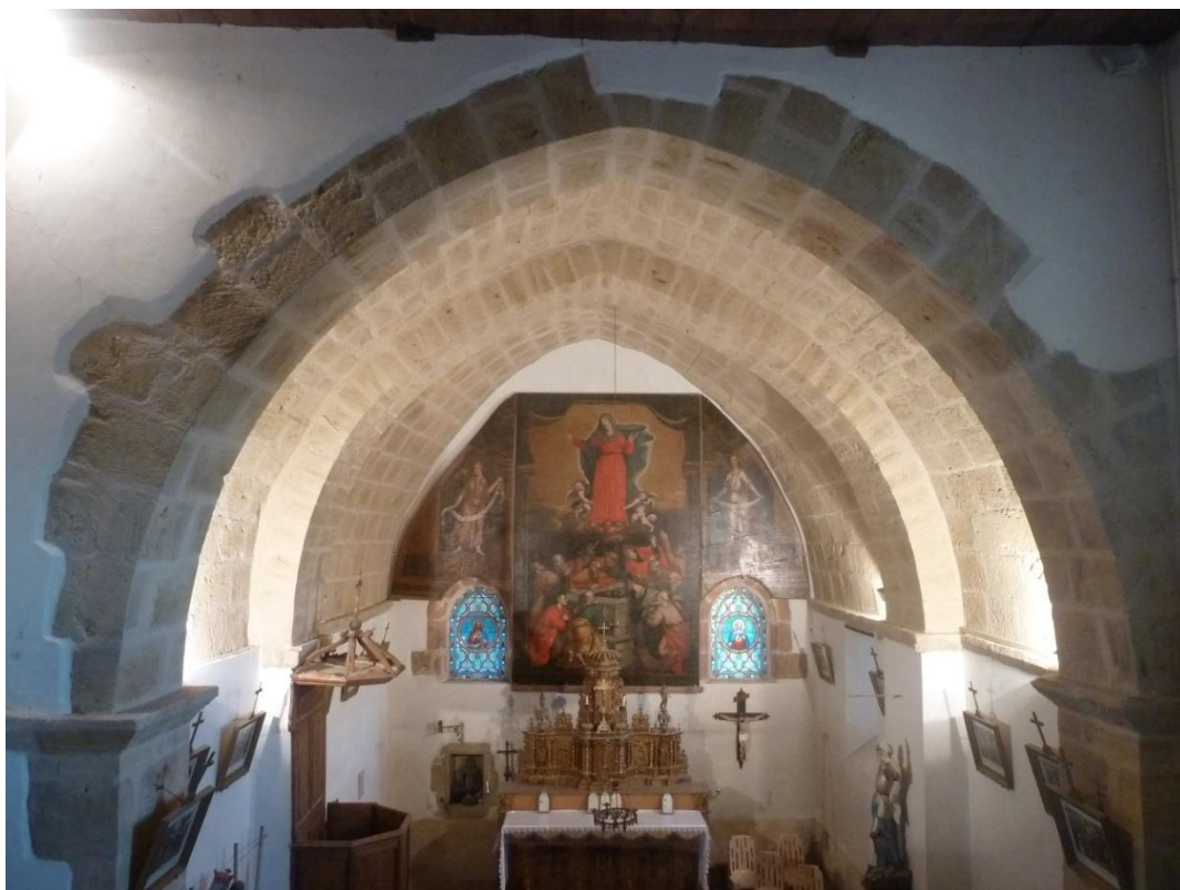
Fig. 13 : Église de Bastanous, vue intérieure, vers l'est