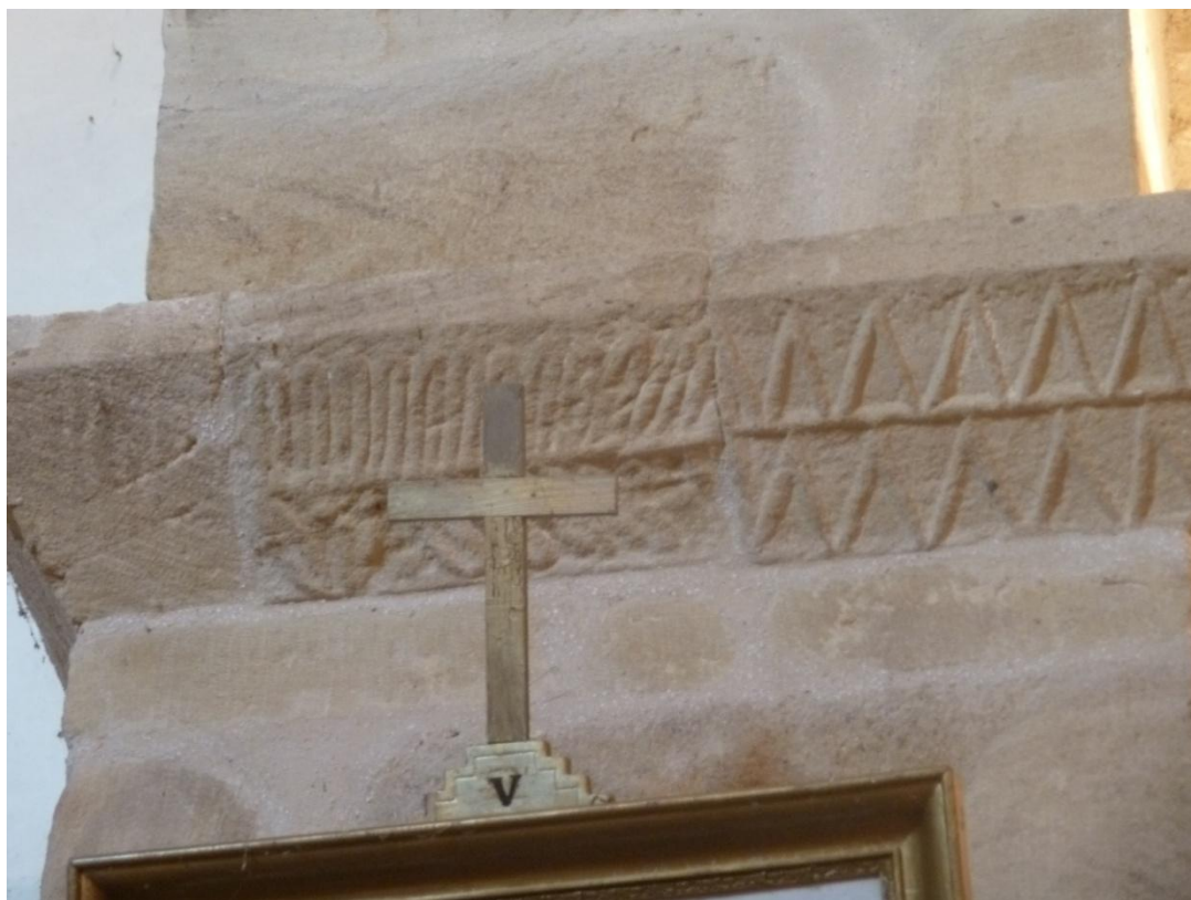
Fig. 14 : Église de Bastanous, le pilastre nord-ouest, détail de l'imposte