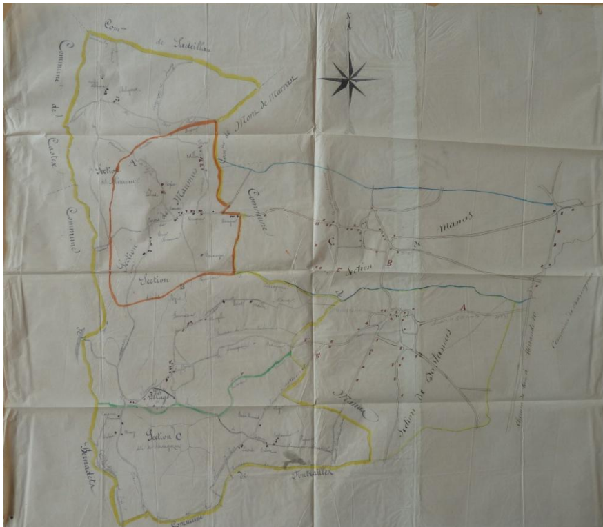
Fig. 2 : AD32, série V 227, plan de la commune de Manas, vers 1881 (sans précision)