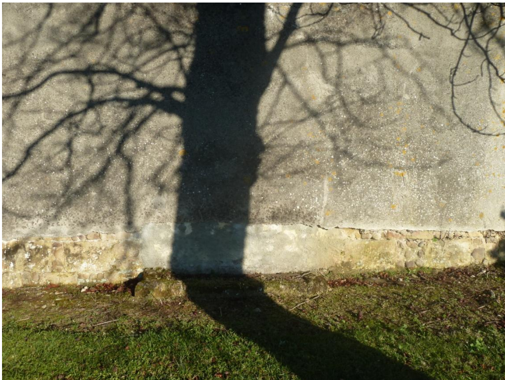
Fig. 18 : Église de Bastanous, élévation ouest de part et d'autre du seuil de l'ancien portail