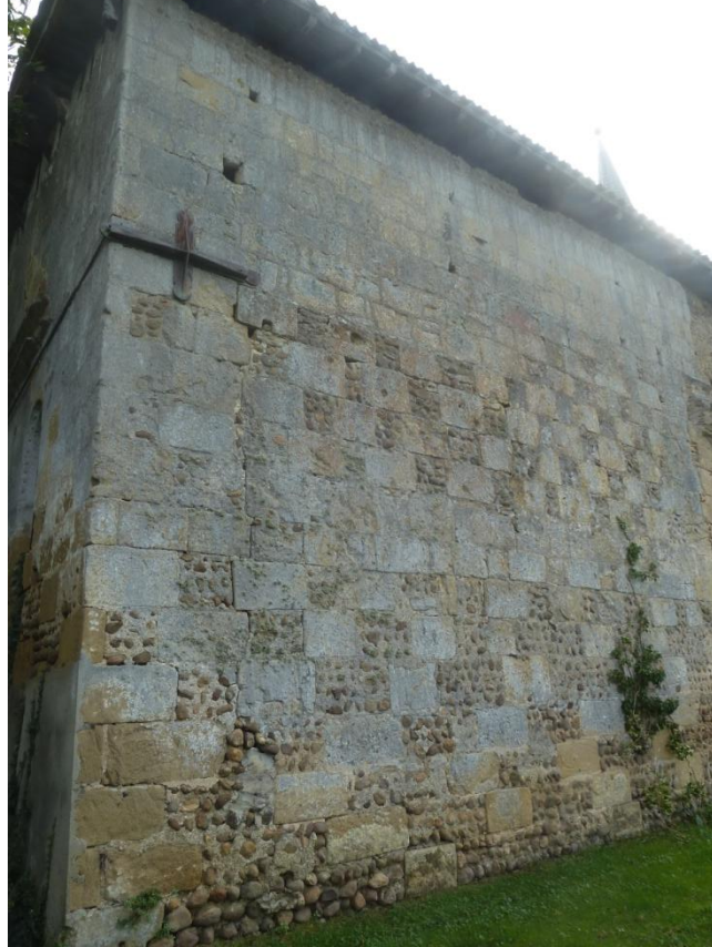
Fig. 16 : Église de Bastanous, élévation nord depuis l'angle nord-est