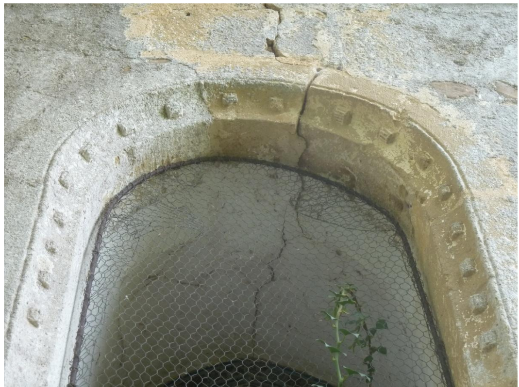
Fig. 12 : Église de Bastanous, le chevet, la fenêtre de droite