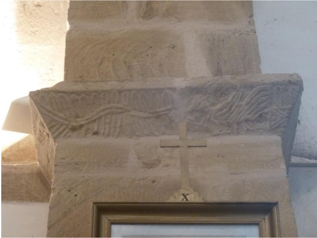
Fig. 15 : Église de Bastanous, le pilastre sud-ouest, détail de l'imposte