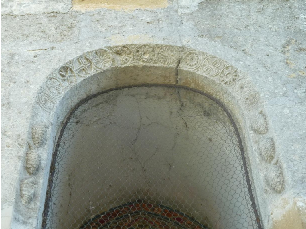
Fig. 11 : Église de Bastanous, le chevet, la fenêtre de gauche