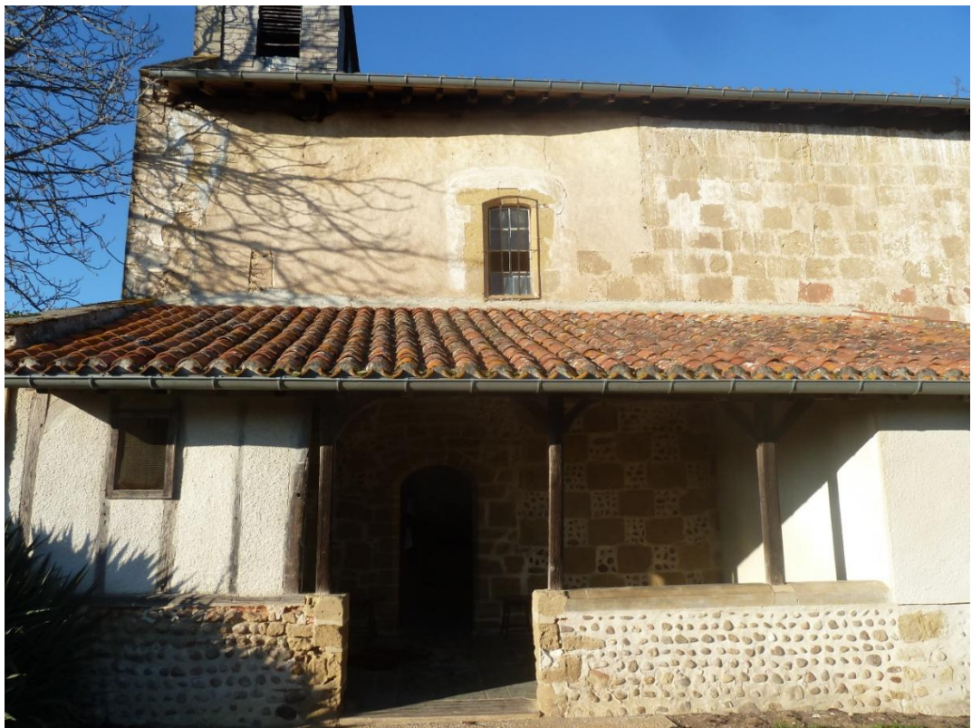
Fig. 6 : Église de Bastanous, la partie occidentale de l'élevation sud de la nef