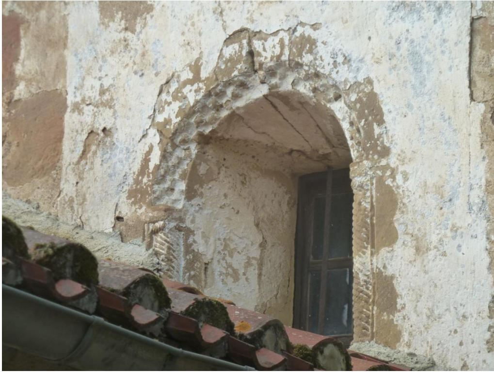
Fig. 9 : Église de Bastanous, la fenêtre sud-est de l'église