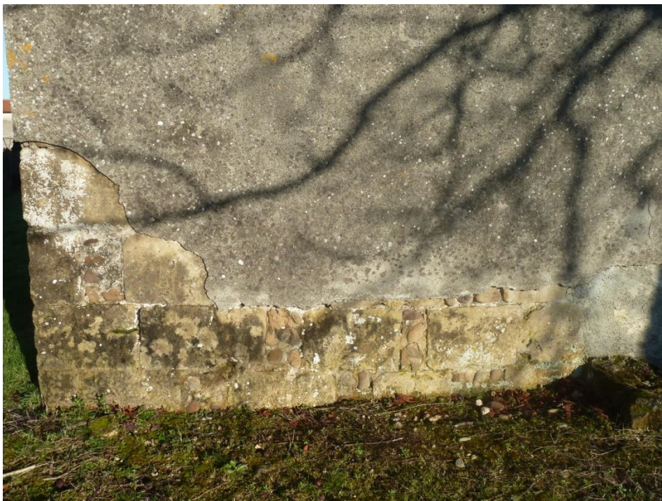
Fig. 32 : Église de Bastanous, élévation du mur ouest, détail de l'angle nord-ouest