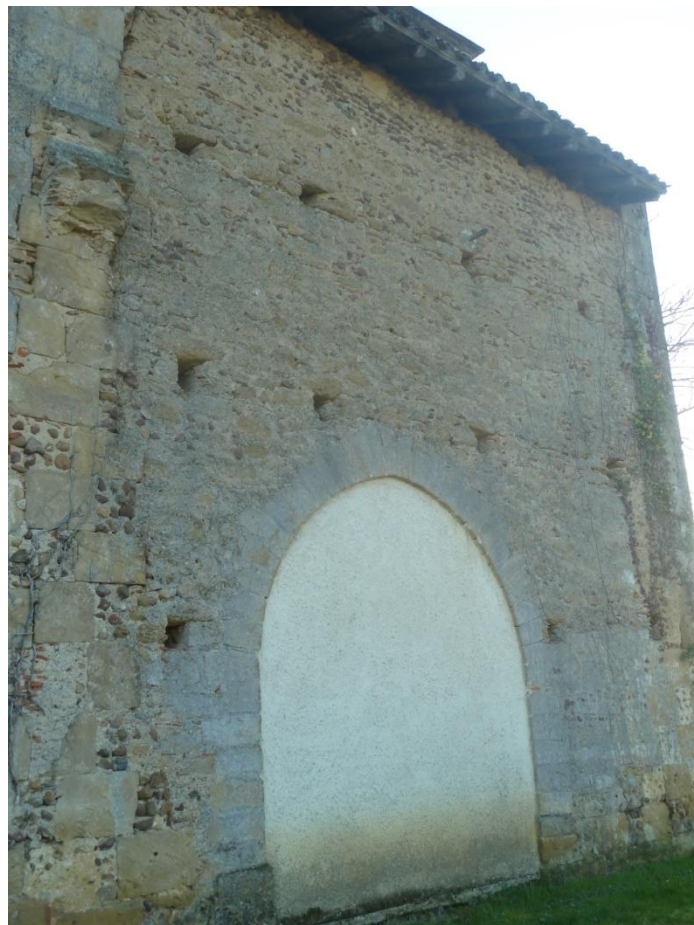
Fig. 30 : Église de Bastanous, élévation du mur nord en direction de l'angle ouest