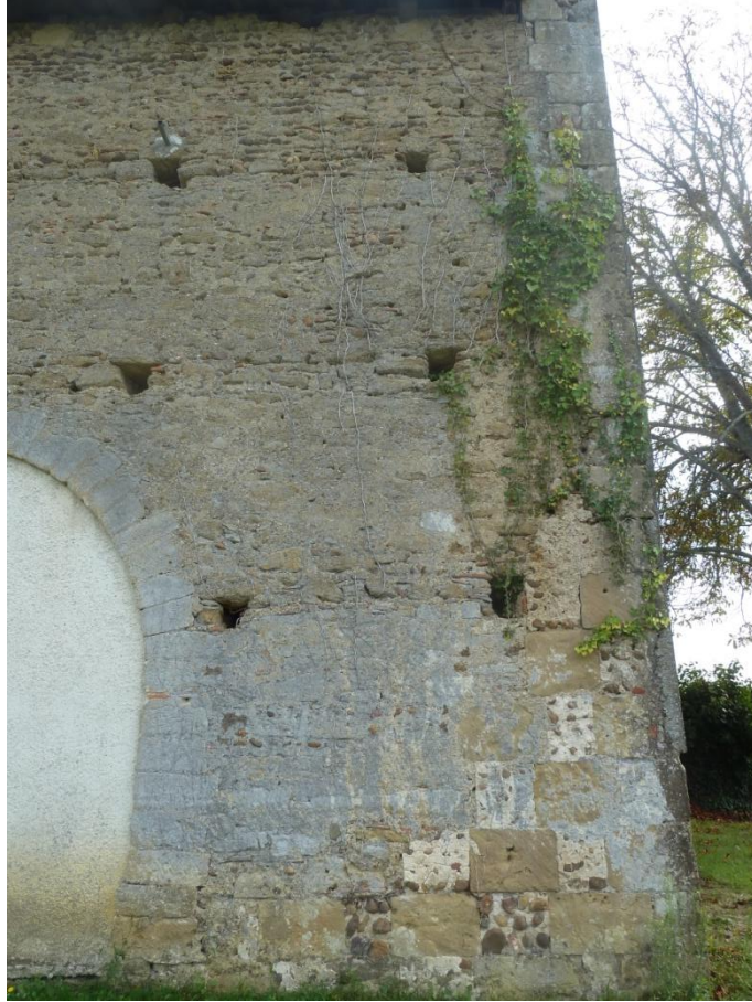
Fig. 31 : Église de Bastanous, élévation du mur nord en direction de l'angle ouest, détail