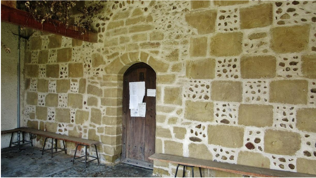
Fig. 5 : Église de Bastanous, le portail sud