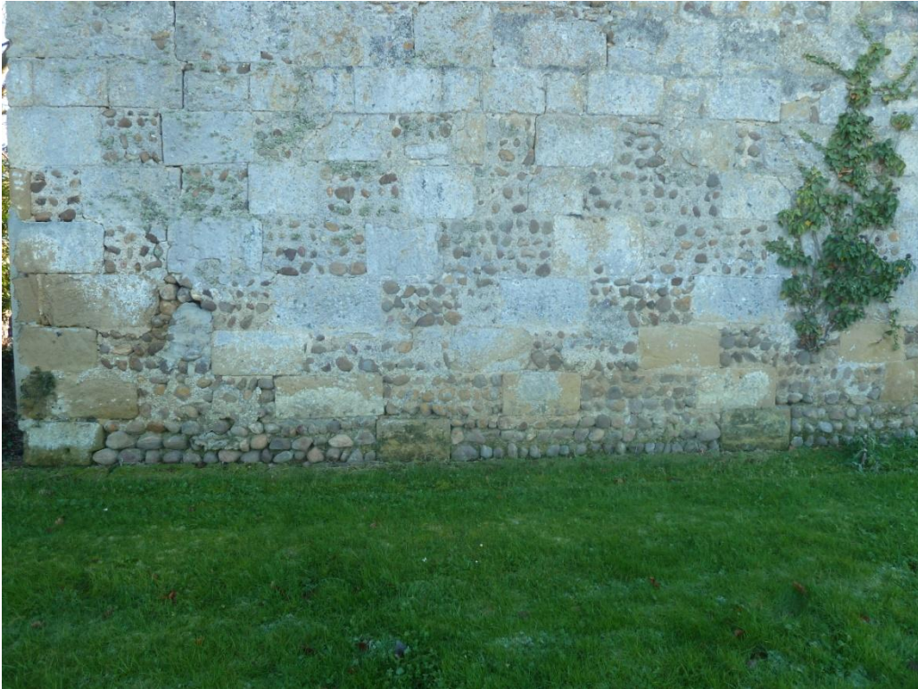
Fig. 19 : Église de Bastanous, détail de l'élevation nord-est (Cl. C. Balagna)