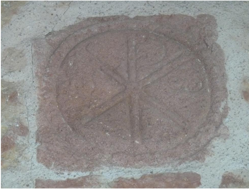
Fig. 1 : Manas-Bastanous, église Saint-Barthélemy de Manas, le chrisme