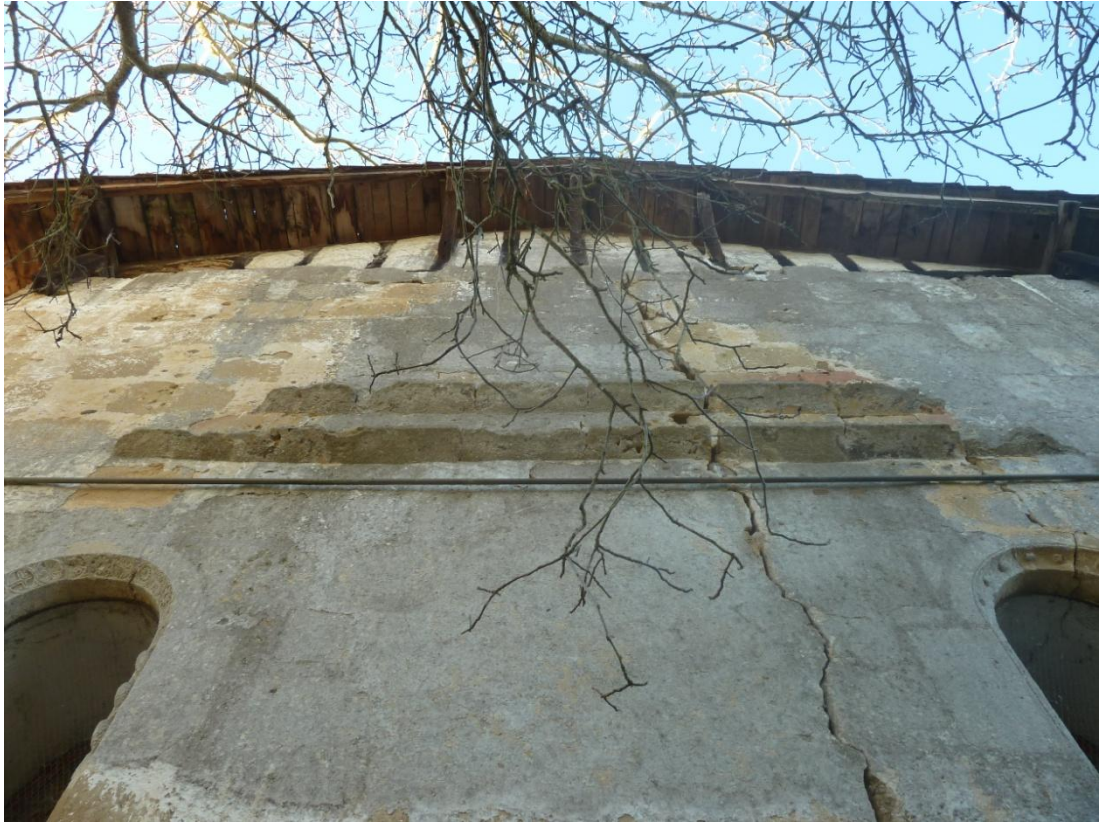
Fig. 23 : Église de Bastanous, élévation orientale, détail