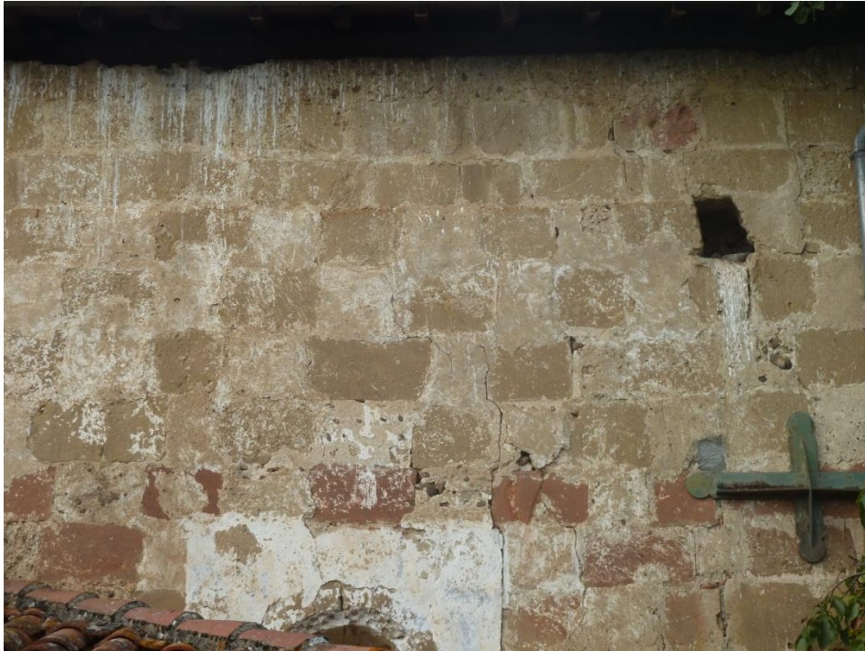
Fig. 25 : Église de Bastanous, vue depuis le sud-est, détail