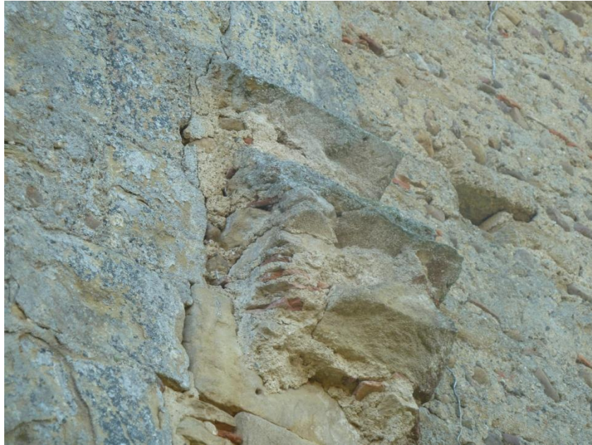
Fig. 29 : Église de Bastanous, élévation du mur nord, à gauche de l'arc d'entrée de la chapelle détruite, détail