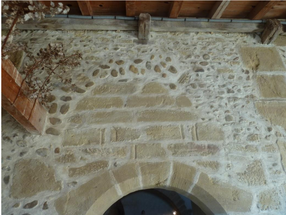
Fig. 7 : Église de Bastanous, la zone située au-dessus du portail (Cl. C. Balagna)