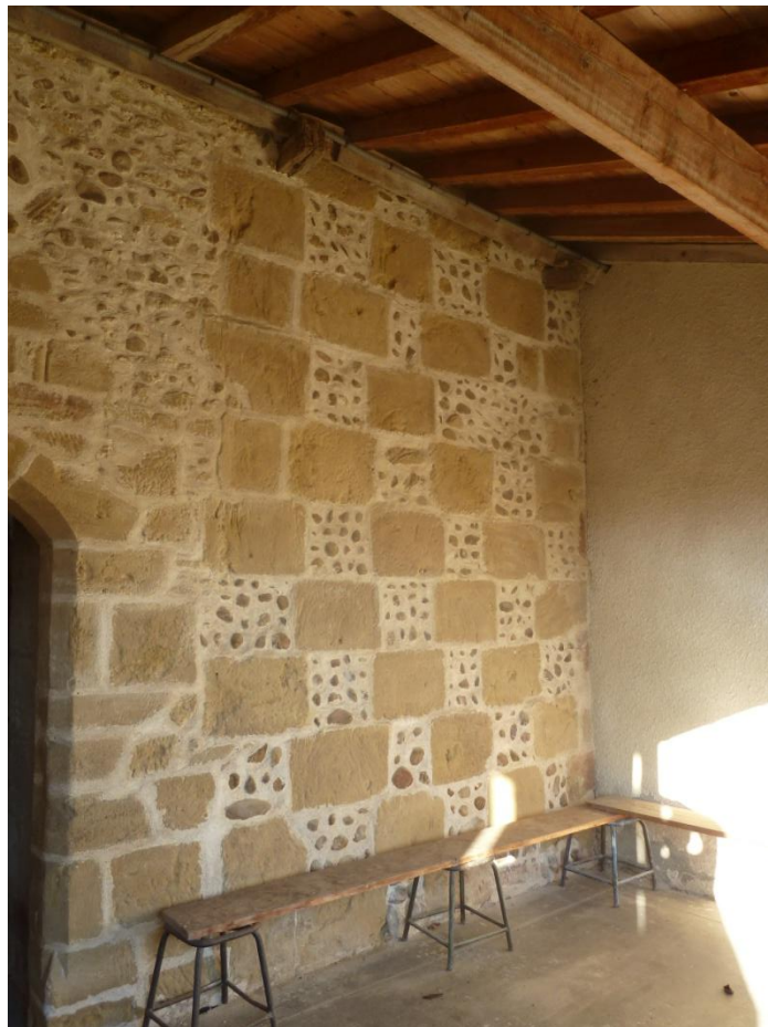
Fig. 26 : Église de Bastanous, élévation du mur sud, à droite du portail