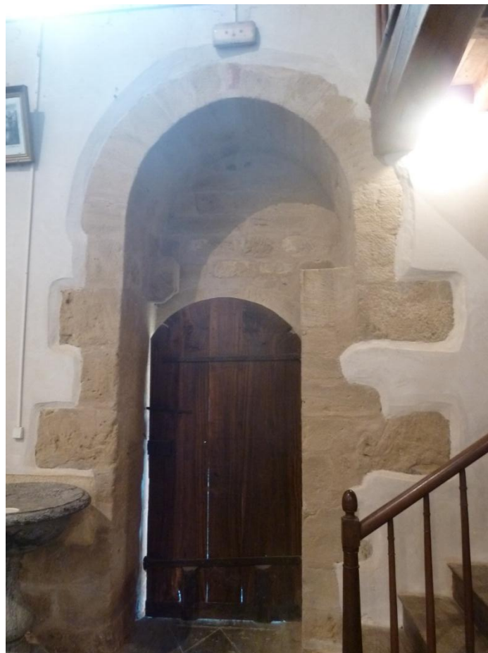
Fig. 8 : Église de Bastanous, la zone du portail vue depuis l'intérieur