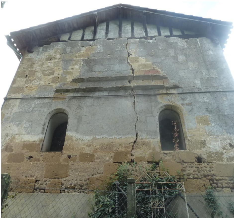
Fig. 10 : Église de Bastanous, le chevet depuis l'est