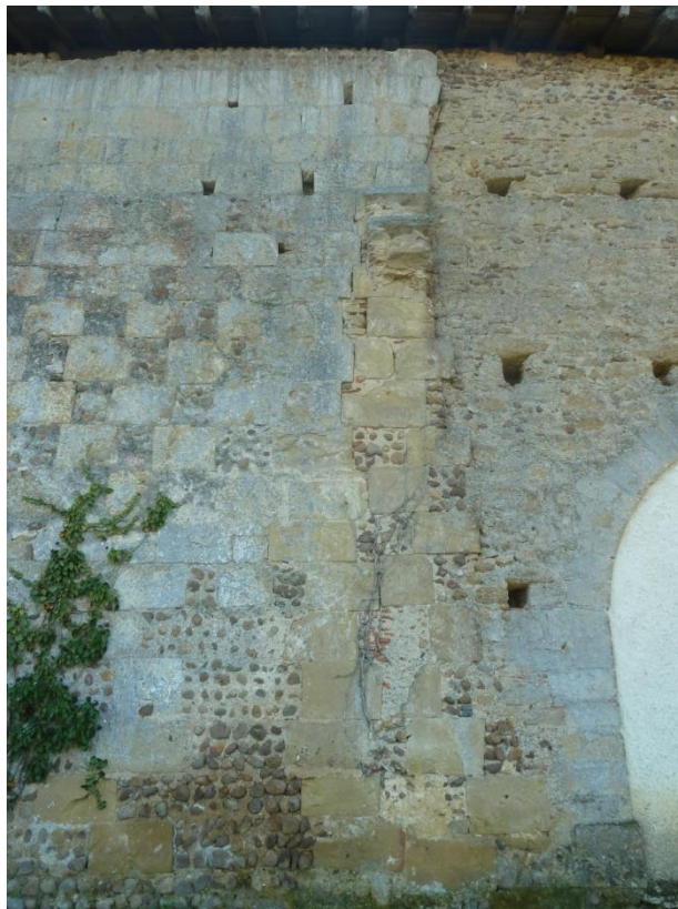
Fig. 28 : Église de Bastanous, élévation du mur nord, à gauche de l'arc d'entrée de la chapelle détruite