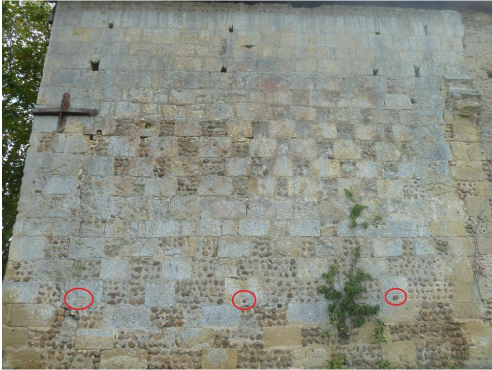
Fig. 21 : Église de Bastanous, élévation nord, les trous de boulin de la 5 e assise