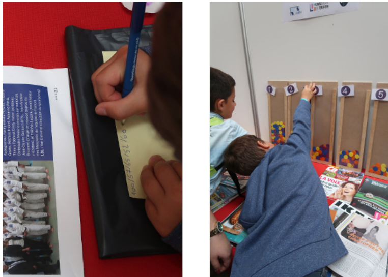
FIGURE 3. Vérification expérimentale de la loi de Benford

Après avoir entouré sur chaque nombre le premier chiffre significatif, chaque volontaire enregistre ensuite ses observations en plaçant un jeton dans la colonne correspondante pour chaque chiffre relevé.