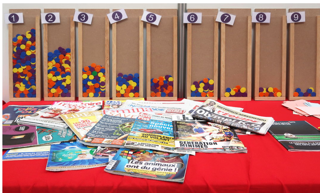
FIGURE 1. Atelier sur la loi de Benford à la fête de la science

il n'est jamais zéro donc ce premier chiffre significatif est toujours l'un des chiffres 1, 2, 3, 4, 5, 6, 7, 8 ou 9. La loi de Benford stipule que les fréquences d'apparition de chacun de ces chiffres au début des nombres que nous rencontrons ne sont pas uniformes : comme indiqué sur le diagramme de la Figure 2, presque un tiers des nombres commencent par un 1, et les proportions décroissent jusqu'à moins d'un sur vingt pour le chiffre 9 !