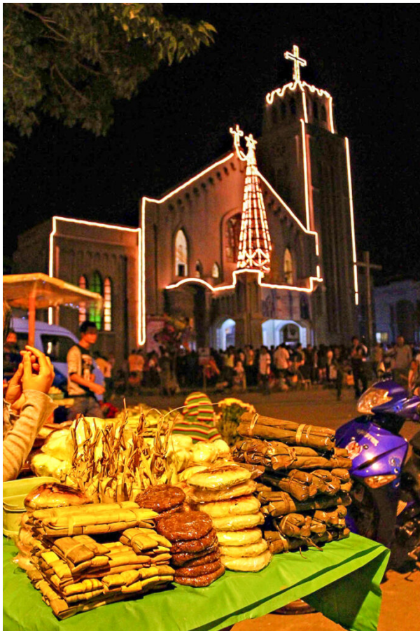
La Neuvaine ou Simbang Gabi du 15 au 24 décembre se déroule la nuit. L'église ne peut en général contenir la foule qui s'y presse. Des vendeurs y déambulent avec des gâteaux de riz et de cassave.

Neuvaine est dédiée à la Vierge Marie et a pour caractéristique de se dérouler très tôt le matin, en général dès 4 heures du matin.