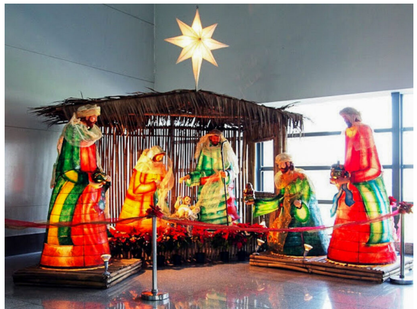
Une crèche installée dans un centre commercial durant les festivités de Noël. Sur le toit, l'étoile traditionnelle philippine ou parol y est souvent représentée.

La ferveur et l'excitation sont toujours très palpables, en particulier à partir de la fin du mois de novembre pendant laquelle les