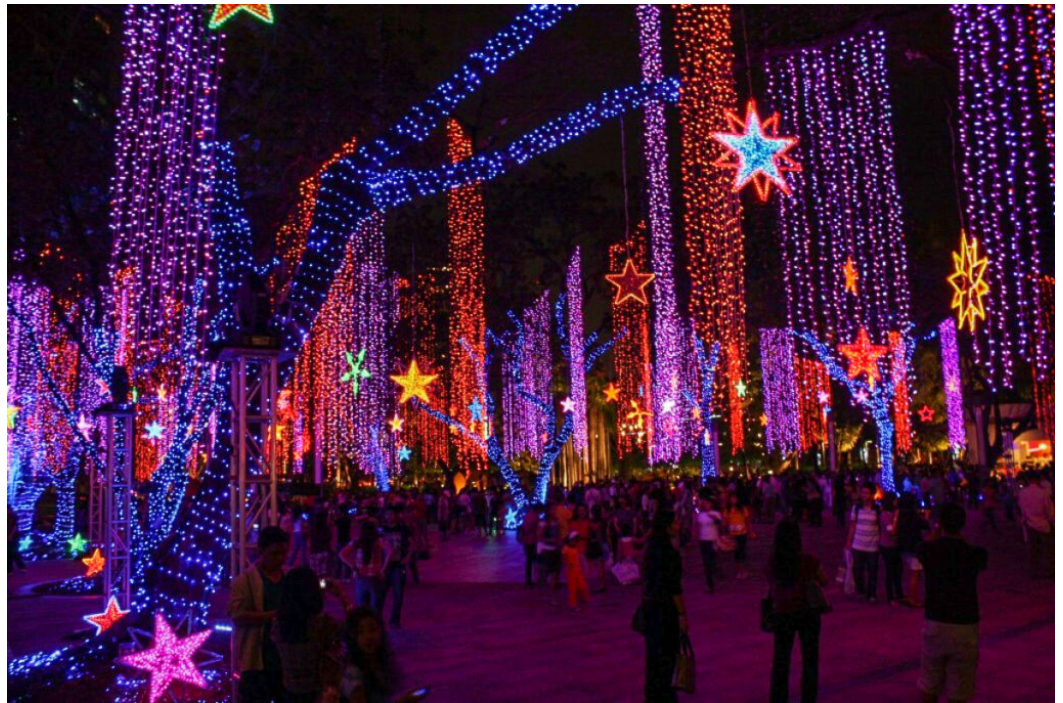
Les lumières du festival of light qui a lieu à Makati City toutes les heures durant la période de Noël font la joie des petits et des grands.

D'autres décorations lumineuses ornent dès le mois de septembre les grands boulevards de Manille et des quartiers d'affaire comme le Makati Central Business District qui organise toutes les heures un « festival des lumières » à la nuit tombée. Des milliers de lumières colorées étincellent et se reflètent sur les vitres des gratte-ciel environnants, offrant un spectacle aussi magnifique que démesuré.