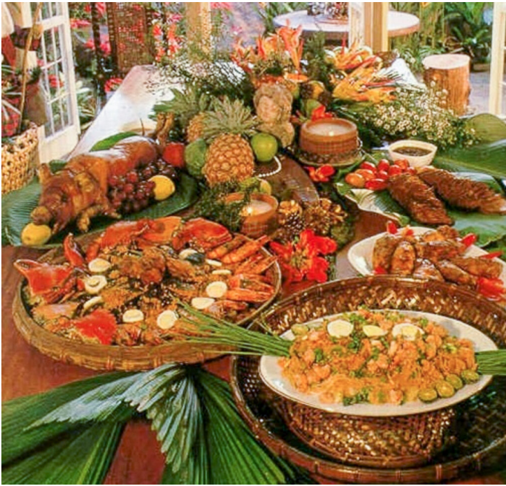
Un exemple de repas de Noël traditionnel philippin pour la Noche Buena (le 24 décembre). De gauche à droite : du cochon de lait grillé, des nouilles avec des fruits de mer, des fruits, du poisson grillé, du poulet frit et des nouilles chinoises.