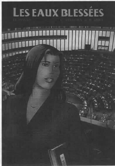
17. BD diffusée par le Parlement européen dans 25 langues.

Les Eaux blessées nous entraîne dans les aventures de la députée européenne Irina Vega, héroïne fictive. Celle-ci est rapporteur de la commission parlementaire