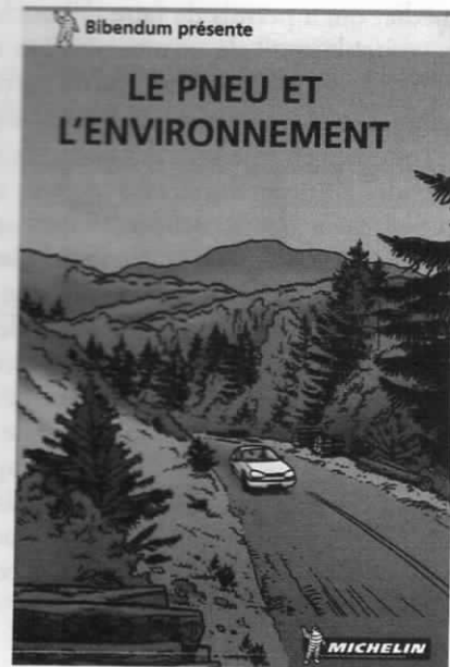
18. BD fabriquée en 2002 pour la communication de Michelin.

Le scénario est extrêmement simple : il suit le questionnement d'un jeune couple à travers sa rencontre avec