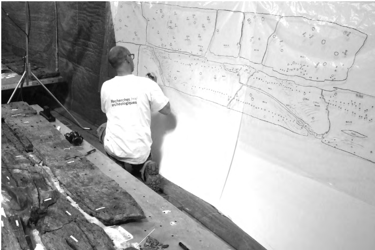
Figure 3 Relevé archéologique, à l'échelle 1, sur film plastique.

Ce travail adapté permet d'obtenir des plans d'une grande précision, qui permettent un suivi de l'ensemble des phases de travail et un enregistrement facilité des opérations de restauration et de lecture archéologique en cours. Ils permettront aussi d'alimenter une base de données pour le suivi du bateau.