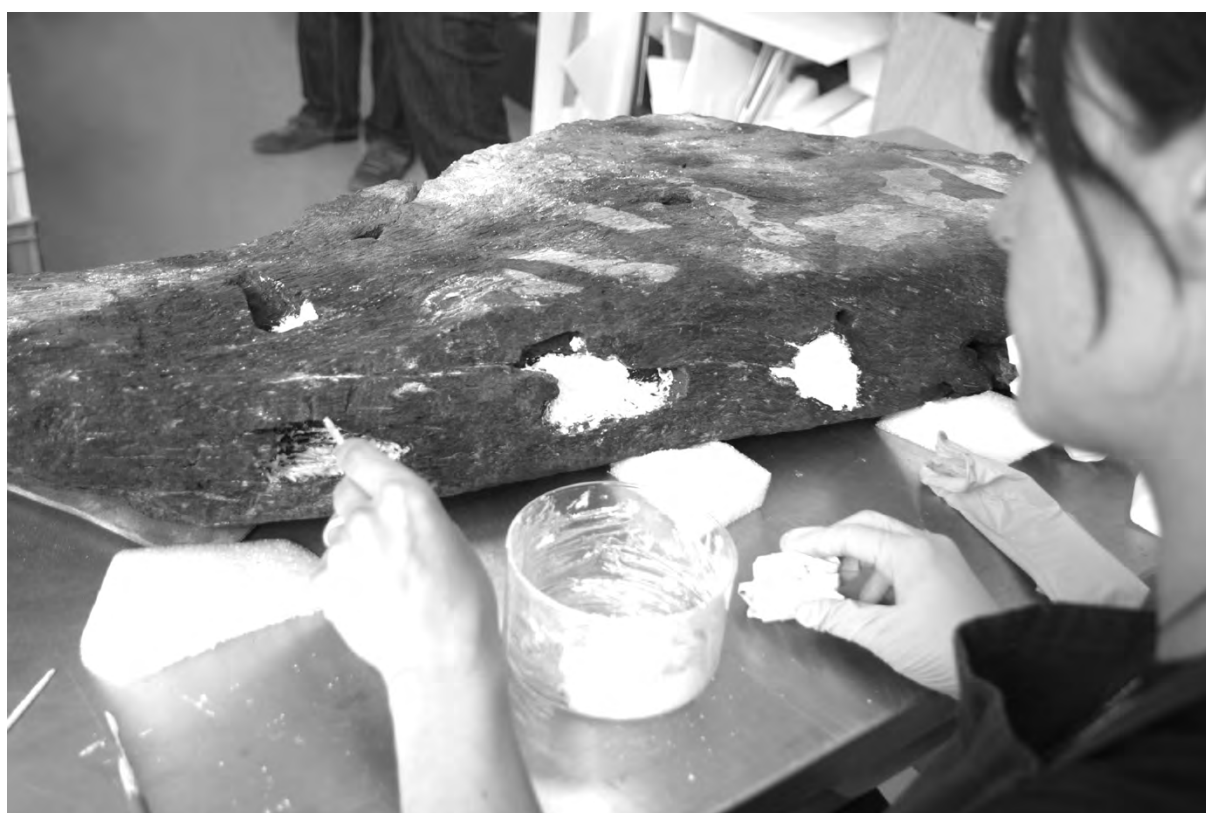
Figure 6 Application de sébaçate dans les trous laissés par le passage de clou.