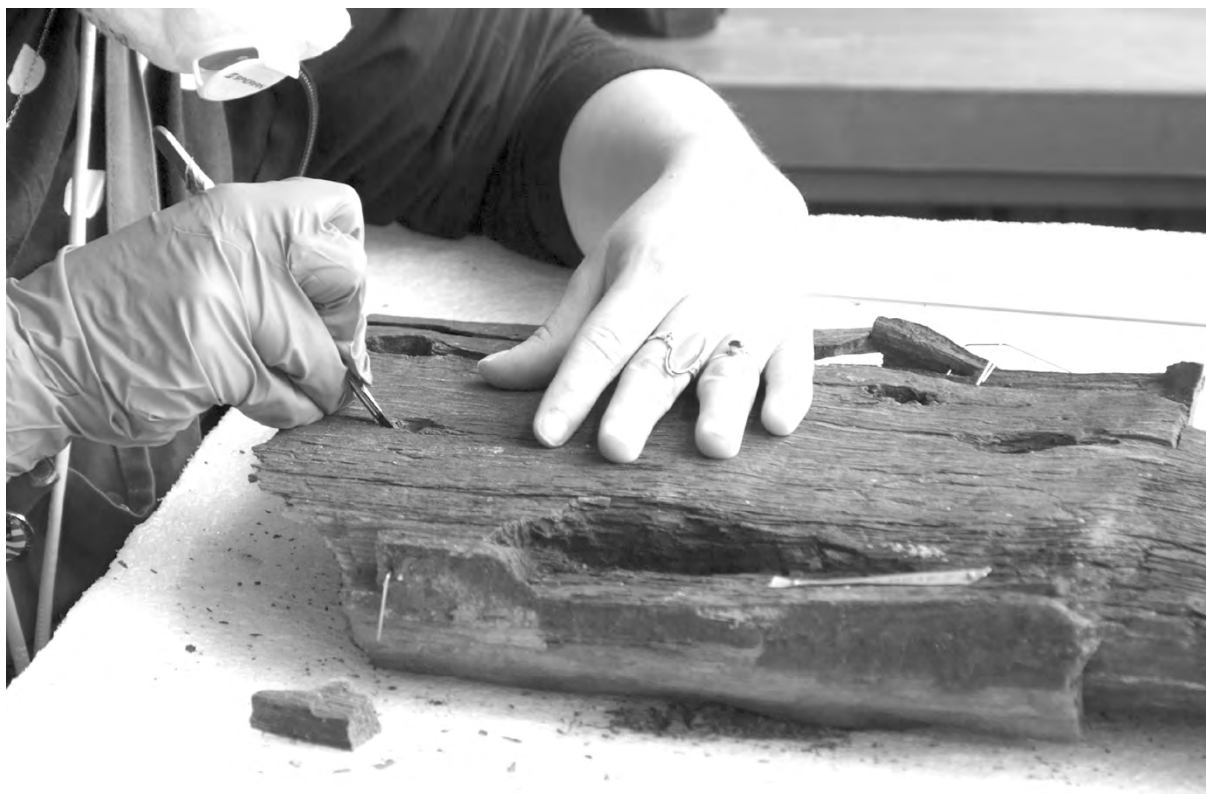
Figure 5 Curetage d'un des fragments de la sole.