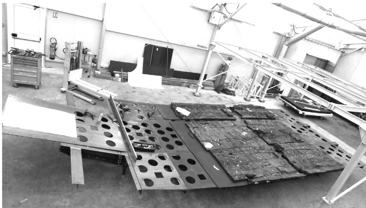
Figure 7 Montage du support de présentation du chaland.