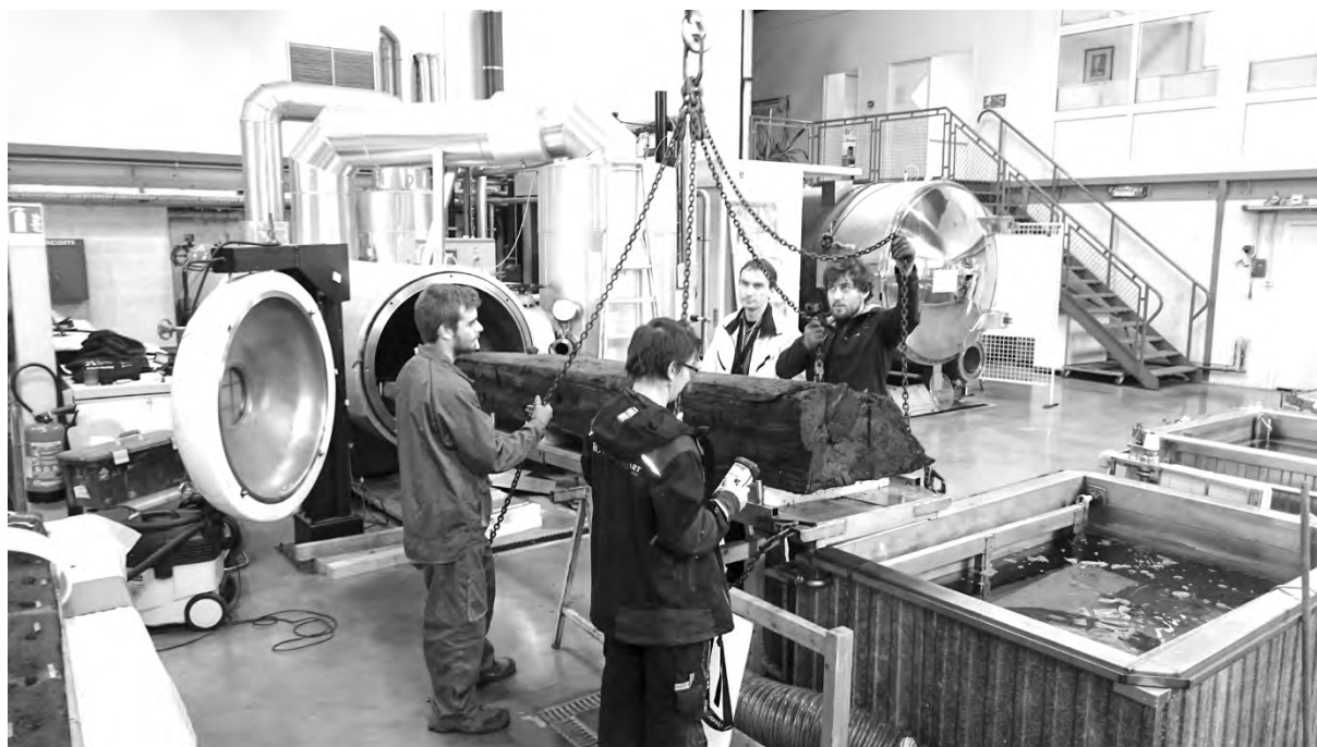
Figure 2 Lyophilisation d'une partie d'un bordé.

étagères en inox, afin de les traiter par imprégnation dans des solutions de polyéthylène glycol (PEG) pendant 8 mois minimum. Le séchage a ensuite été effectué par cycles successifs de 3 à 8 semaines (vu le volume de bois), par lyophilisation ( fig. 2 ). Cette technique consiste à congeler à -30\text{ }^{\circ}\text{C} sous vide les bois imprégnés de la solution de PEG, des sondes de température étant insérées dans les bois afin de suivre leur évolution en temps réel. Le phénomène de sublimation de la glace permet, en étant sous vide, d'absorber la pression partielle de vapeur se formant au-dessus de l'objet congelé, et ainsi de le sécher sans repasser en eau liquide, pour éviter de le déformer. L'ensemble des lyophilisations pour ce chaland a duré 18 mois sans interruption, en utilisant deux lyophilisateurs.