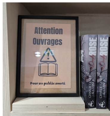
Figure 2. Mise en garde dans une librairie indépendante au niveau du rayon Dark Romance, 2024