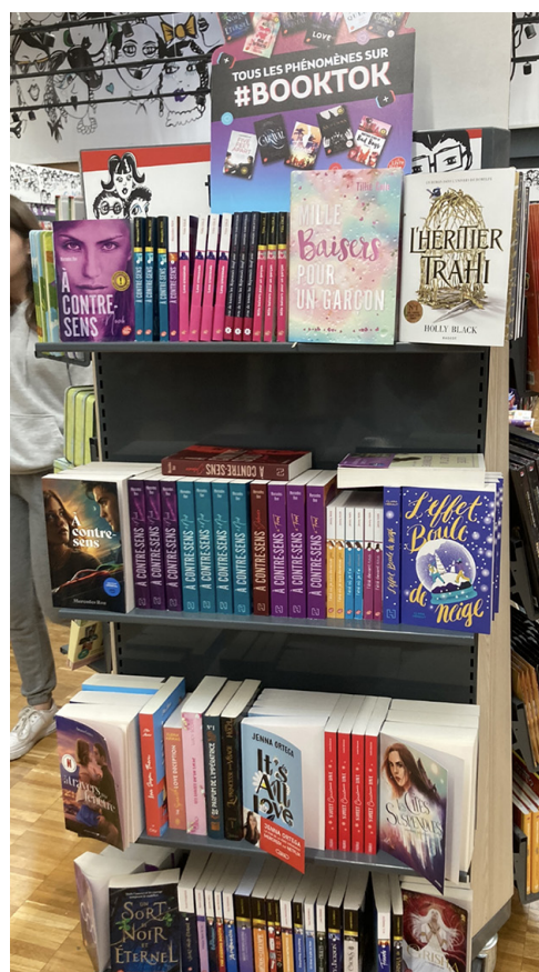
Figure 4. Rayon New Romance en librairie avec une mise en avant de Booktok, 2023