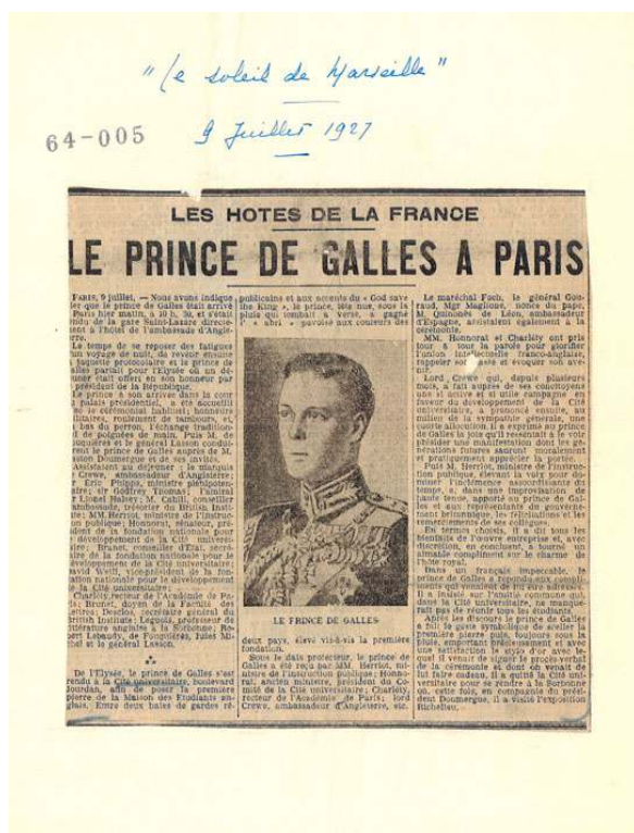
« Le prince de Galles à Paris », extrait du Soleil de Marseille relatif à la première pierre du Collège franco-britannique, 9 juillet 1927.

Phot. Richard, Damien. © Arch. nat. Fontainebleau, 20090013 art. 1062.