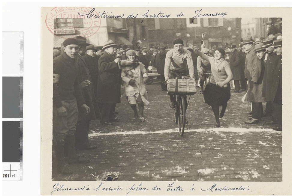
Critérium des porteurs de journaux [1928], Arch. nat., 8 AR/534.