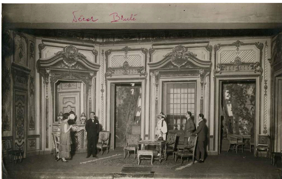
Décor avec acteurs de L'Amour vient après , mise en scène par Raymond Silva et Marcel Silvain, décor n° 38, Théâtre de l'Odéon, 1932.