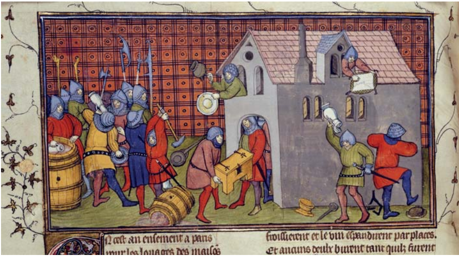
Fig. 3 - Pillage de l'hôtel d'Étienne Barbette à Paris en 1306. Londres, British Library Royal 20 CVII, fol. 41 verso, Chroniques de France ou de Saint-Denis