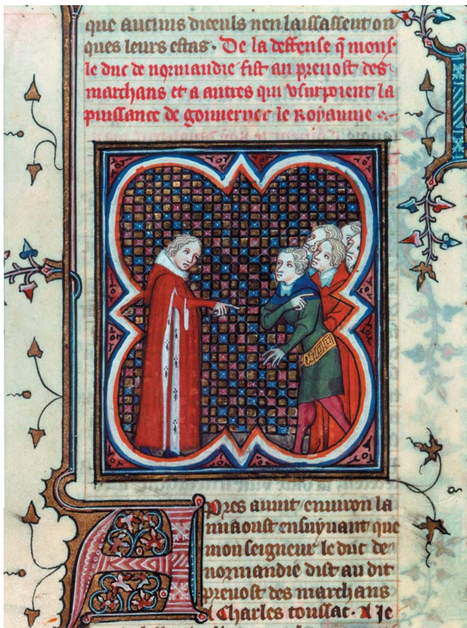
Fig. 2 - Charles, dauphin de France et régent (futur Charles V) et Étienne Marcel (mi août 1357).

Paris, BnF, fr 2813, fol. 404 verso Grandes Chroniques de France de Charles V