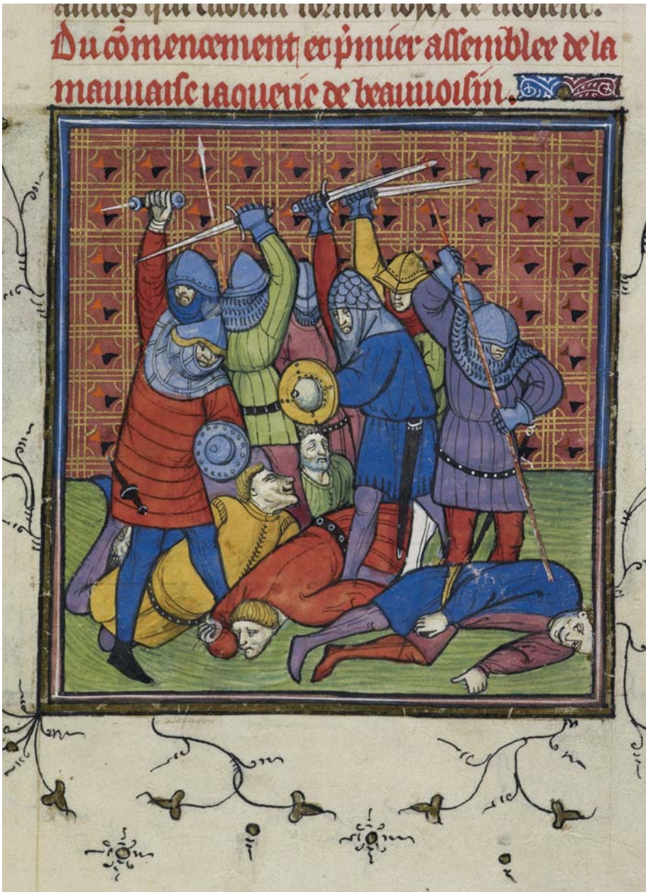
Fig. 4 - Jacquerie, massacre de nobles (28 mai 1358). Londres, British Library Royal 20 CVII, fol. 133, Chroniques de France ou de Saint-Denis