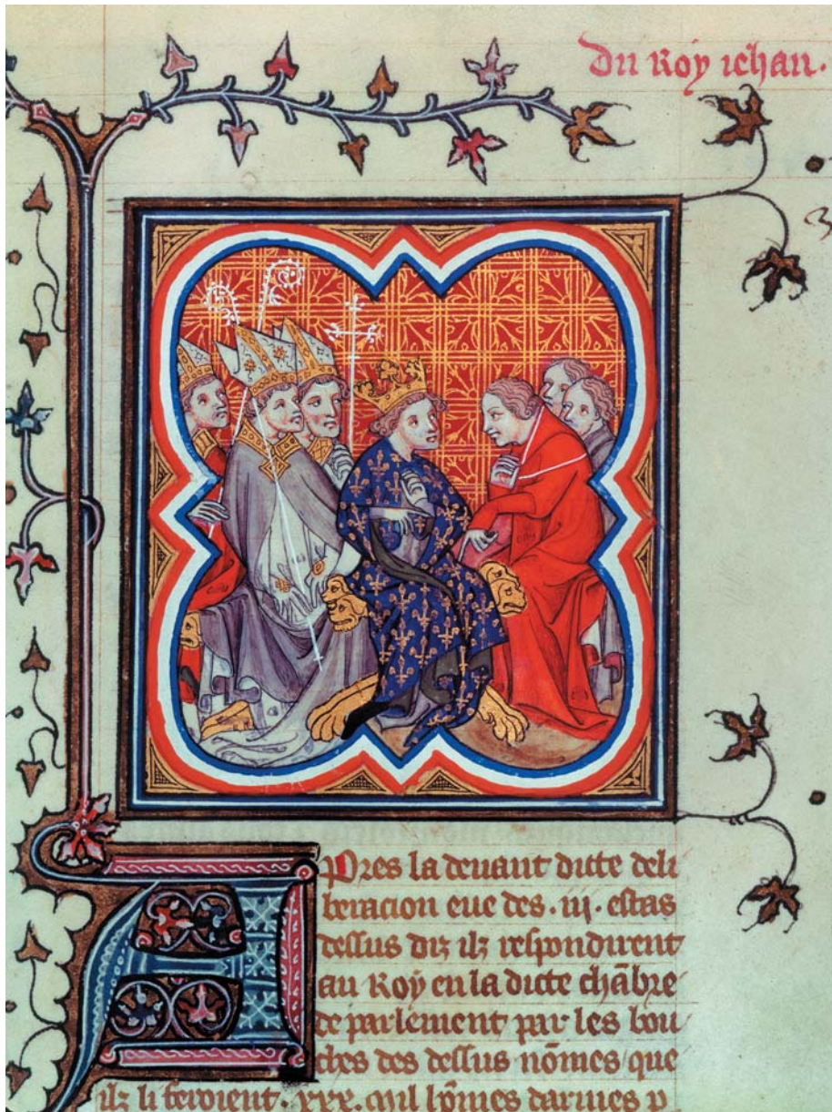
Fig. 1 - Jean II le Bon, roi de France et les États (30 novembre 1355). Paris, BnF, fr 2813, fol. 397, Grandes Chroniques de France de Charles V