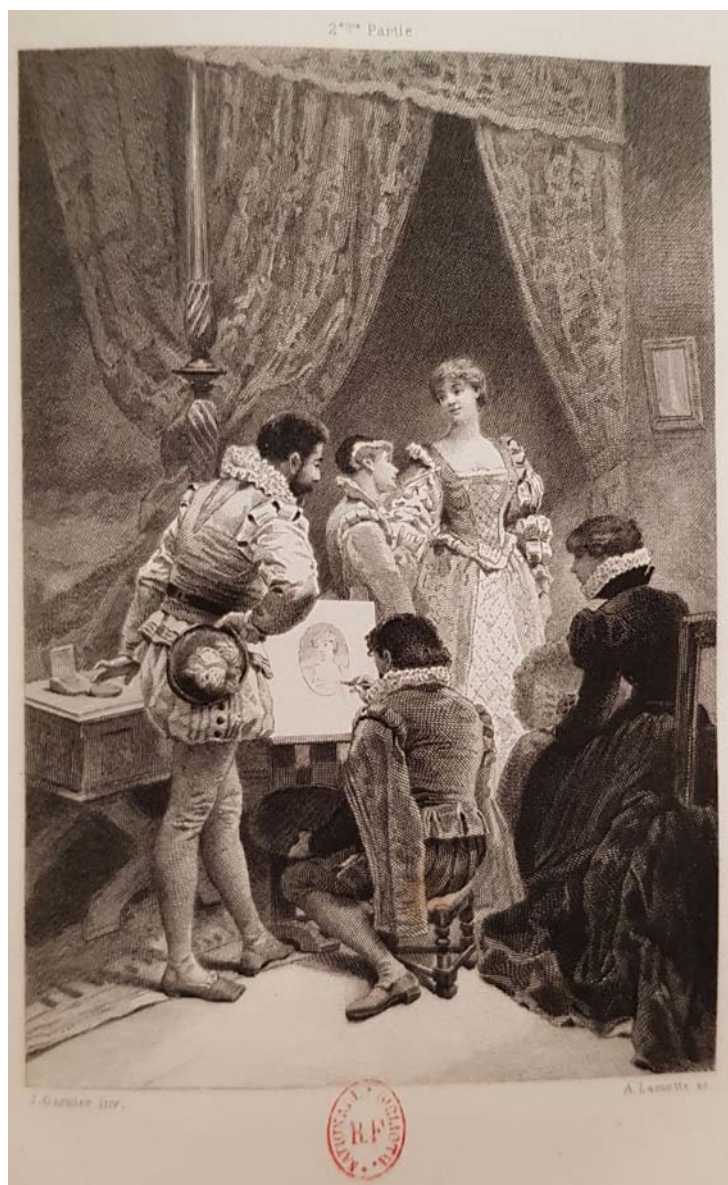
Figure 8. Dessin de Jules-Arsène Garnier gravé par Alphonse Lamotte, M me de Lafayette, La Princesse de Clèves , Paris, A. L. Conquet, 1889.