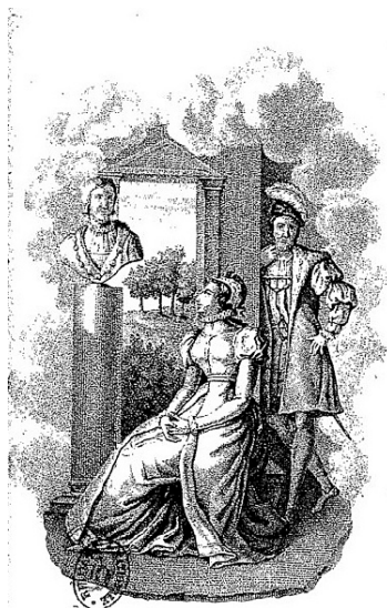
Figure 1. Gravure anonyme, François-Marie Mayeur de Saint-Paul, Madame de Lafayette , Paris, Le Fuel, 1813.