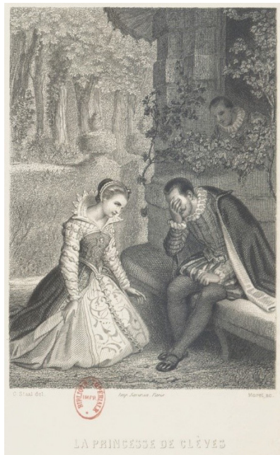
Figure 4. Gravure de Gustave Staal, M me de Lafayette, La Princesse de Clèves , Paris, Garnier, 1863.