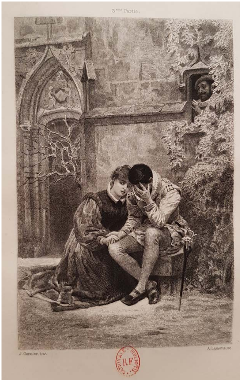
Figure 9. Dessin de Jules-Arsène Garnier gravé par Alphonse Lamotte, M me de Lafayette, La Princesse de Clèves , Paris, A. L. Conquet, 1889.