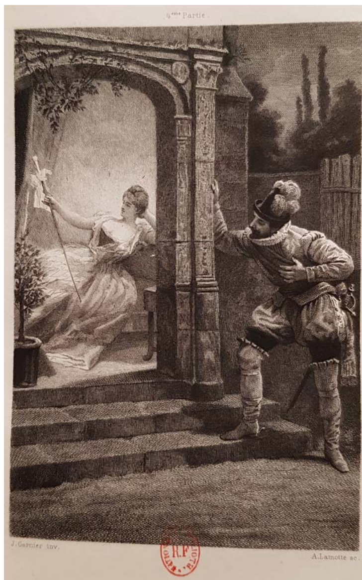
Figure 10. Dessin de Jules-Arsène Garnier gravé par Alphonse Lamotte, M me de Lafayette, La Princesse de Clèves , Paris, A. L. Conquet, 1889.