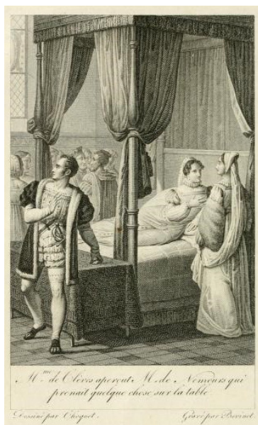
Figure 2. Dessin de Pierre-Jean-Baptiste-Isidor Choquet gravé par Edme Bovinet, Œuvres complètes de M mes de La Fayette, de Tencin et de Fontaines , Paris, Lepetit, 1820, tome II.