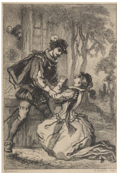
Figure 6. Gravure d'Alphonse-Charles Masson, M me de Lafayette, La Princesse de Clèves , Paris, Quantin, 1878.