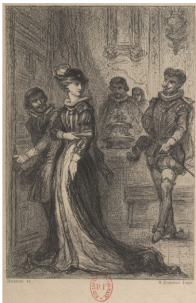
Figure 5. Gravure de Masson, M me de Lafayette, La Princesse de Clèves , Paris, Quantin, 1878.