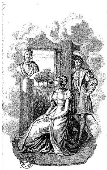
Figure 1. Gravure anonyme, François-Marie Mayeur de Saint-Paul, Madame de Lafayette , Paris, Le Fuel, 1813.