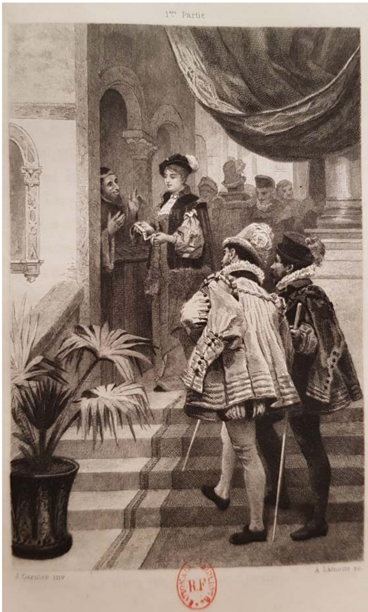
Figure 7. Dessin de Jules-Arsène Garnier gravé par Alphonse Lamotte, M me de Lafayette, La Princesse de Clèves , Paris, A. L. Conquet, 1889.