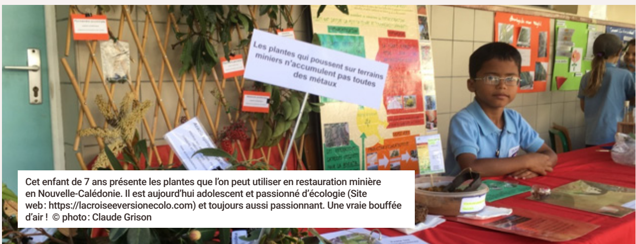
Cet enfant de 7 ans présente les plantes que l'on peut utiliser en restauration minière en Nouvelle-Calédonie. Il est aujourd'hui adolescent et passionné d'écologie (Site web: https://lacroiseevernionecolo.com ) et toujours aussi passionnant. Une vraie bouffée d'air!

Ces travaux initialement destinés à préserver la ressource en eau, nous ont amenés à découvrir l'intérêt des plantes exotiques envahissantes qui se développent dans les milieux aquatiques et les zones humides. Qu'elles soient utilisées pour dépolluer l'eau ou non, elles possèdent à chaque fois des avantages physiologiques qui nous ont permis de les transformer en des outils incontournables d'une chimie durable et conçue sur le long terme. Il s'agit des écocatalyseurs; ils permettent de préparer des molécules pour notre bien-être et notre santé à l'aide de procédés bio-inspirés et respectueux de la nature. https://www.chimeco-lab.com .