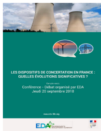
Les dispositifs de concertation en France: quelles évolutions significatives ? 20 septembre 2018

https://eda-lille.org/comment-rendre-la-concertation-plus-democratique/