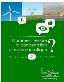
Comment rendre la concertation plus démocratique ? 18 mars 2015

Il s'agissait, lors de l'atelier-débat que nous avons proposé, d'identifier dans un premier temps les problématiques de la concertation telle que pratiquée et exercée lors d'enquêtes publiques, Commissions Locales d'Informations (CLI), débats publics concernant notamment l'environnement et les risques industriels et technologiques. Puis, à partir des questions/réponses entre participants et intervenants, de dresser des pistes d'amélioration (méthodes, moments...) l'objectif était de hiérarchiser les étapes à franchir pour reconquérir une envie de participer davantage mais surtout d'être entendu .