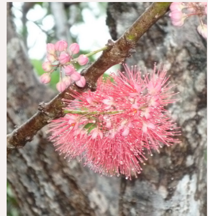
Une plante magnifique et généreuse, qui est aussi un hyperaccumulateur de nickel que nous utilisons en restauration minière en Nouvelle-Calédonie.

Certaines plantes aquatiques sont dotées d'un système racinaire extrêmement bien fait: en les étudiant au niveau moléculaire, c'est-à-dire à l'échelle de la chimie, nous avons identifié leur capacité, vivantes ou mortes (sous forme de poudres végétales), à séquestrer des quantités importantes de polluants métalliques et organiques. Cette technique a été automatisée et elle est devenue suffisamment robuste pour être industrialisée. Aujourd'hui, elle permet de traiter des effluents industriels, mais