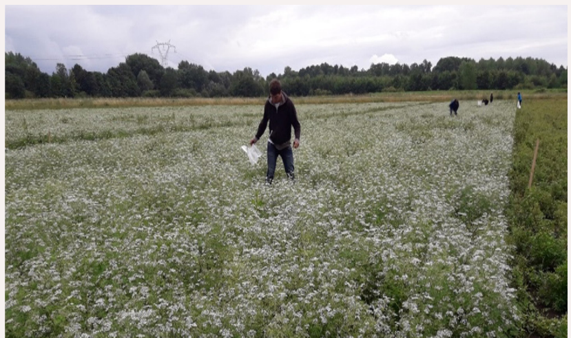
Photos du sol pollué par les ET du site Metaleurop Nord cultivé avec des plantes aromatiques pour la production des huiles essentielles (projets PHYTEO et DEPHYTOP).

Aujourd'hui , Anissa LOUNES – HADJ SAHRAOUI porte un intérêt particulier à la caractérisation du microbiote des sols pollués phytomanagés et au développement de nouvelles filières de valorisation de la biomasse produite sur sols pollués. Elle a coordonné plusieurs projets de phytomanagement dont les projets PHYTEO et DEPHYTOP sur la production des huiles essentielles à activités biologiques à partir de la culture de plantes aromatiques sur sols pollués : un marché mondial en pleine expansion car les huiles essentielles trouvent leur utilité dans divers domaines d'application à vocation non-alimentaire, tels que les industries cosmétiques, pharmaceutiques et phytosanitaires.