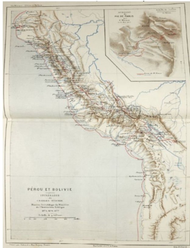
1. Mapa del itinerario del viaje de Charles Wiener (Wiener, 1880 ; XIV)