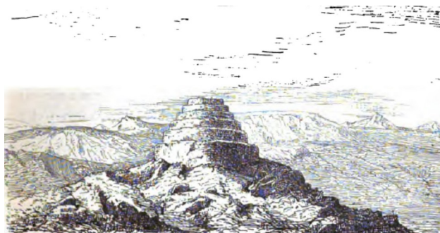
3. Ruina del fuerte Huinchux (Wiener, 1880 ; 191)