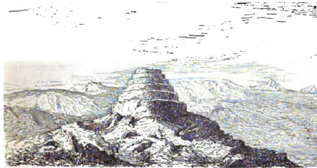
3. Ruina del fuerte Huinchux (Wiener, 1880 ; 191)