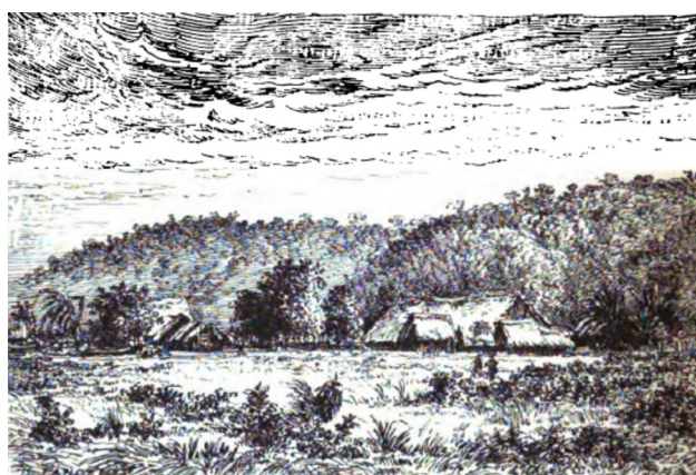
4. Hillapani, Valle de Santa Ana (Wiener, 1880 ; 348)