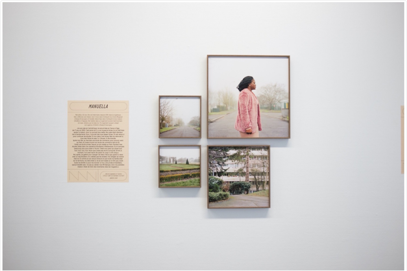
Figure 4 : Itinéraires avec Manuella, Ile-de-France, 2018. Vues de l'exposition à la Maison Robert Doisneau, Gentilly, septembre 2020.