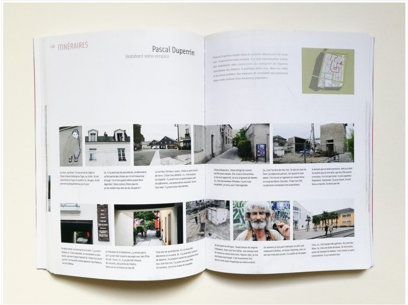
Figure 1: Extrait du ouvrage de Jean-Yves Petiteau et Bernard Renoux, Nantes, récit d'une traversée Madeleine-Champ-de-Mars, Carré, 2012.