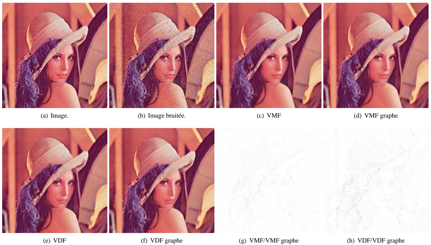
Figure 3 – Comparaison entre ordres pour des filtres médians.