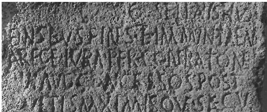
Fig. 1 : vue d'ensemble et détail des lignes 6-9.

On en conclut que les nouvelles photographies valident la première lecture de J. Desanges : les ligatures désormais un peu plus visibles sur les clichés invitent à restituer co(n)iurationem plutôt que confirmationem . Cette lecture semble également préférable pour une raison d'ordre historique : il est douteux qu'Auguste soit intervenu dans une affaire ayant un enjeu aussi local, même si l'on peut supposer que le double bénéfice concédé aux Thudedenses , assurément très appréciable, était motivé par un service important qu'ils avaient rendu au roi « ami et allié de Rome » 10 . C'est là qu'intervient la question de l'origine du privilège, dont le texte ne dit mot. M. Bouchenaki et P.-A. Février ont essayé d'y apporter des réponses : ils ont évoqué la mise en valeur de terres par les Thudedenses ou un service ancien rendu à Octave pendant les guerres triumvirales 11 . Mais l'hypothèse sur laquelle ils reviennent par deux fois et qui semble avoir implicitement leur préférence concerne les liens que les Thudedenses auraient eus avec le mausolée royal (dit « Mausolée de la Chrétienne ») qui, du fait de sa proximité, pourrait bien s'être trouvé sur leur territoire : les éditeurs évoquent la possible participation de la communauté à la construction de l'édifice ou bien à son entretien. Ils restent cependant très prudents sur le sujet en raison de l'incertitude où l'on est de l'extension réelle du territoire des