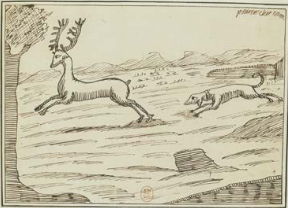
Dessin 4 "pour le cher sorom"