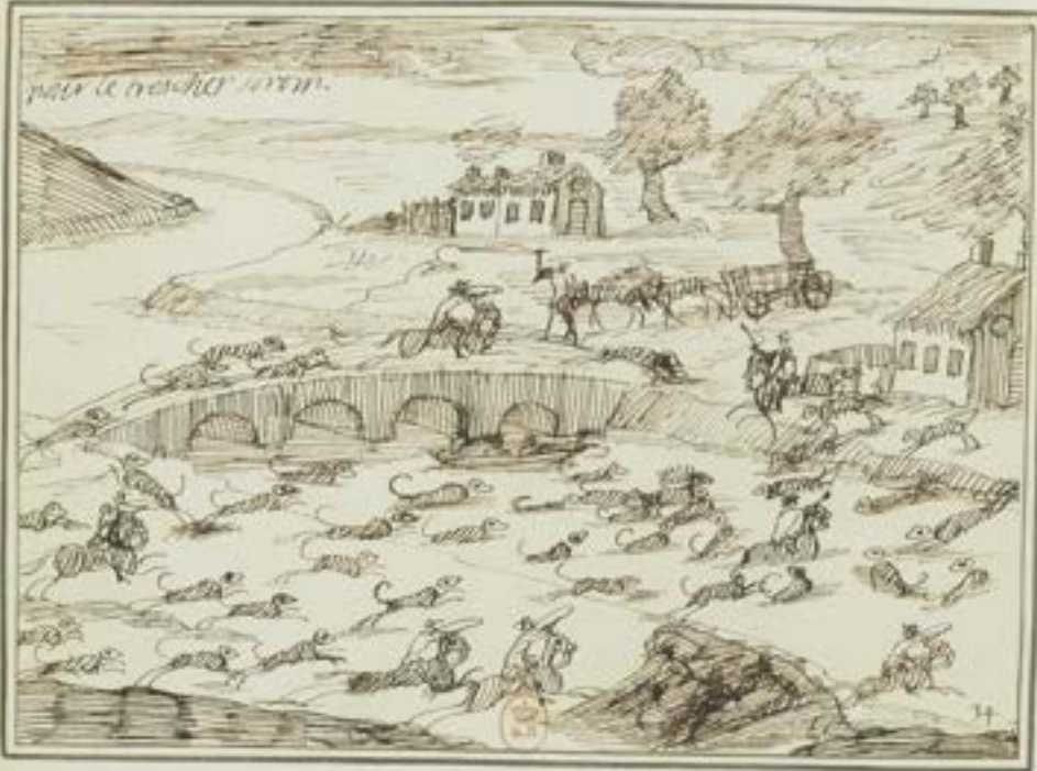
Dessin 34 "pour le très cher sorom"