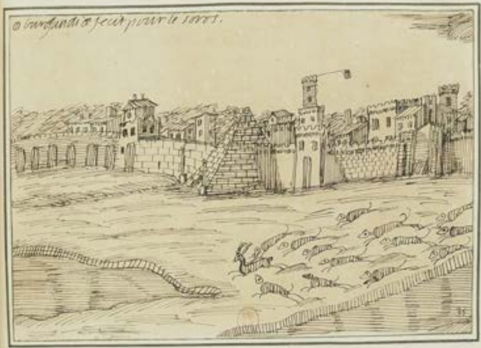
Dessin 35 "Dux Burgundiae fecit pour le soros"