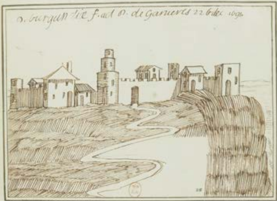
Dessin 28 réalisé "ad D. de Ganières"