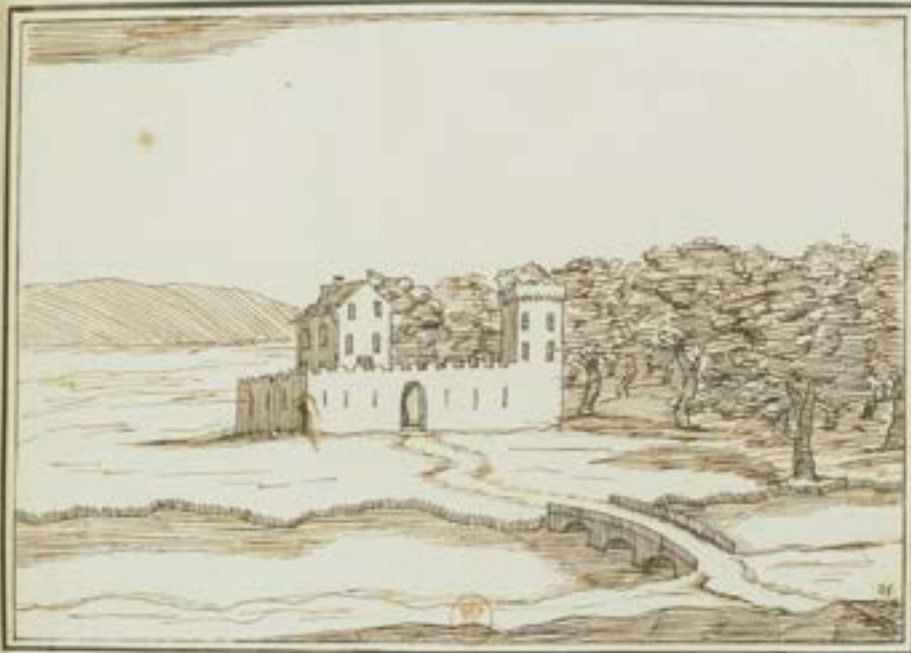
Dessin n° 25