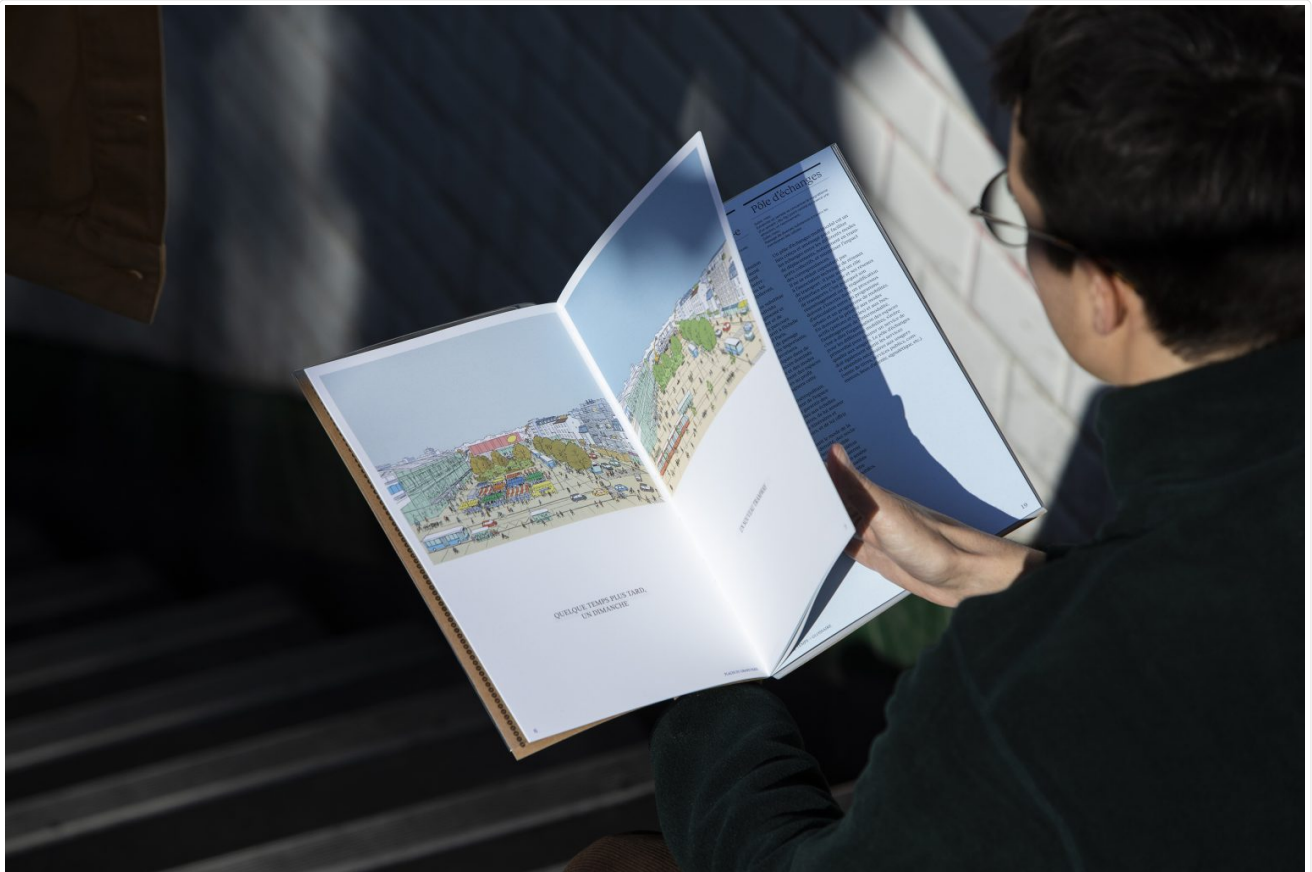
Figure 4: La « narration » dessinée par Martin Etienne dans le guide