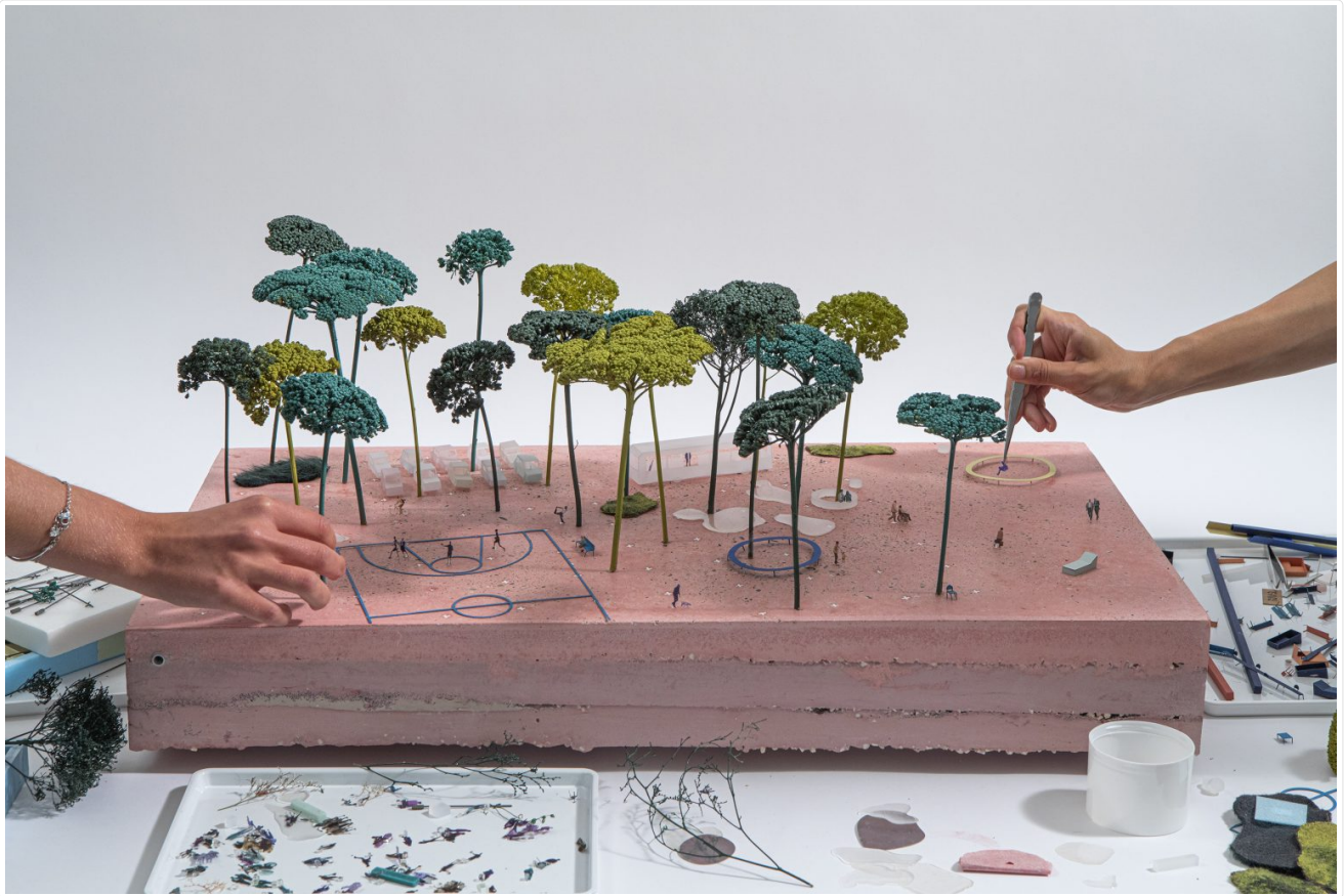
Figure 7: Une des quatre maquettes réalisées pour l'illustration des principes