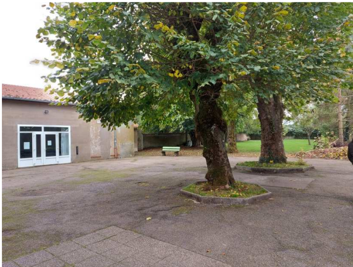
Figure 2. Situation de la cour d'école avant travaux

Au premier plan, les racines des deux vieux arbres, dont l'ombrage est très apprécié des enfants et de l'instituteur autant dans la cour que sur les vitrages du bâtiment, ont soulevé l'enrobé.