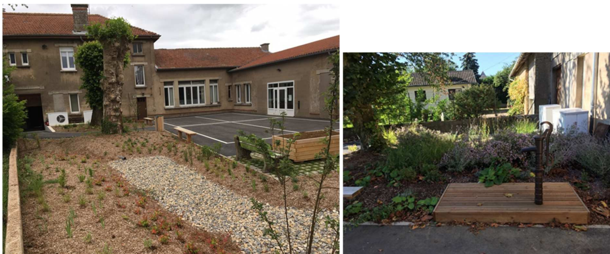
Figure 7. Cour d'école après les travaux

« J'étais parti sur l'idée d'une simple reprise de l'enrobé existant, mais le projet paysager apporte un vrai plus pour les enfants de l'école, mais également pour les habitants qui profiteront de la cour hors temps scolaire (usage comme parc public et comme jardin de la salle des fêtes) » (Figure 7).