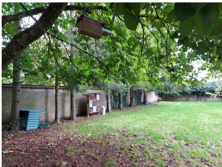
Figure 5. Niche et hôtel à insectes dans la cour d'école