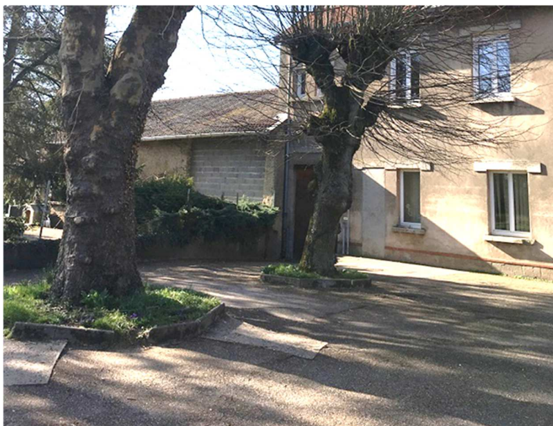
Figure 6. Accès à la cour d'école par le garage de la mairie (entre le mur mitoyen et les deux grands arbres)