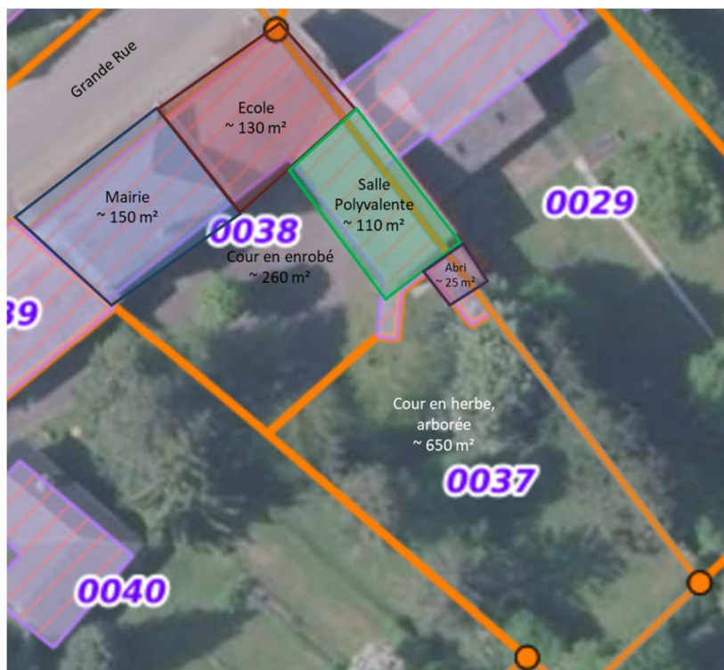
Figure 4. Localisation et superficie des bâtiments et des deux parties de l'école

Parcelle : la Figure 4 permet de localiser la cour d'école, sa superficie et celle d'une partie des bâtiments également concernés par l'opération de déconnexion des eaux pluviales. La surface globale concernée par le projet est de 535 m 2 .